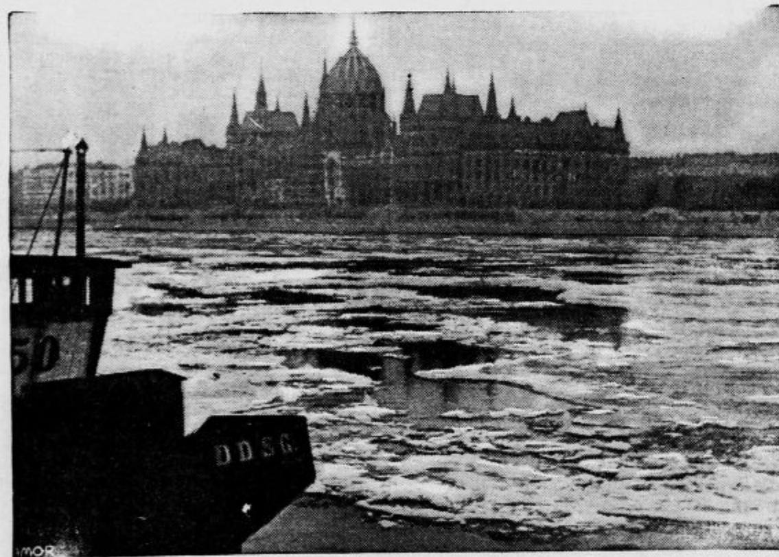
Po Donavi pred madžarsko prestolnico plavajo zdaj velike množine ledu