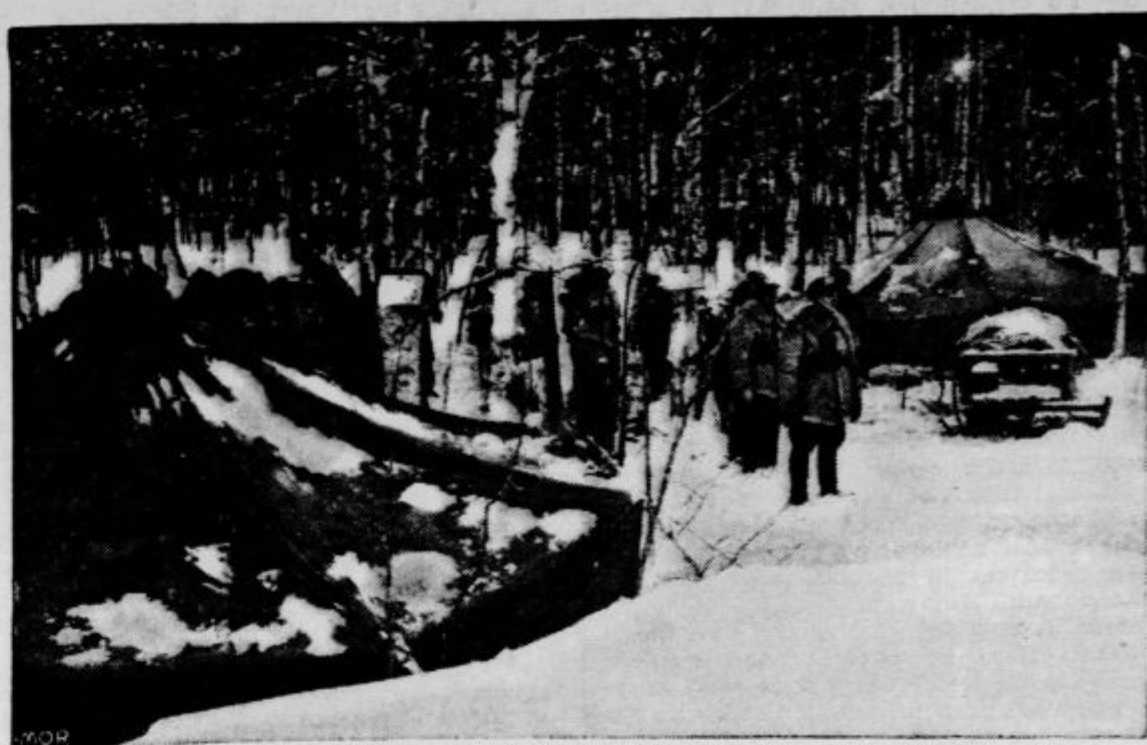
Finska vojska je zaradi nepretrganega bivanja na bojišču močno izčrpana. Ta slika prikazuje oddelek borcev v zaledju med odmorom