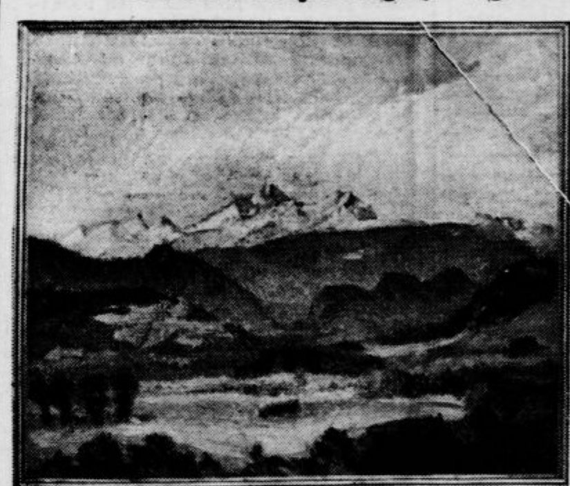
25. t. m. bo zaradi svoje nove vsebine in novega razstavljalca gotovo sanimala občinstvo, ki poseča naše razstave

lagoma nadaljujejo pot iz Save v Dunav. Moč ledu je ogromna, kajti taki bloki lahko zdrobijo, kar se jim postavi po robu, pa naj bo iz lesa, zidu ali železa. Komisarji ladijske policije v Beogradu je naročil, da se izselijo iz nevarnega območja vse družine. Kakor na beograjski, je živahno tudi na zemunski strani.