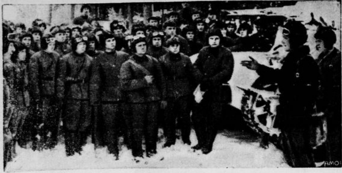
Eden izmed redkih posnetkov, ki prikazuje skupino sovjetskih vojakov na ozemlju severne Finske