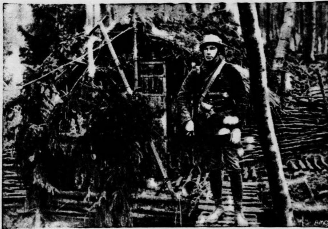
Francoski vojak na straži pred Maginotovo linijo