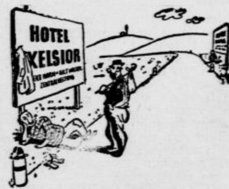
»Veste, jaz se navadno vedno tukaj spodijem in povrh tega še zastojem.« (»Settebello«)