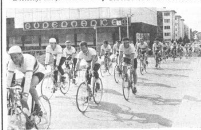
Udeleženci lanskoletne akcije »Gorenje po Jugoslaviji '86« na ulicah Bihaća

obiskom »Hiše cvetja« v Beogradu. Z letošnjo akcijo »GORENJE