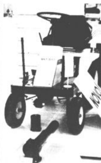
Ena zadnjih novosti Gorenje Muta, mali komunalni traktor s priklučki, namenjen za vzdrževanje športnih igrišč, je vzbujal veliko pozornost obiskovalcev 25. Mednarodnega kmetijsko živilskega sejma v Gornji Radgoni.

goni pa so ob Gorenju Muta in Gorenje Fecro razstavljale svoje izdelke tudi druge Gorenjeve delovne organizacije iz Titovega Velenja, Nazarij, Gornje Radgone in Lendave. Vrsto Gorenjevih izdelkov pa je bilo na sejmu mo- goče tudi kupiti.