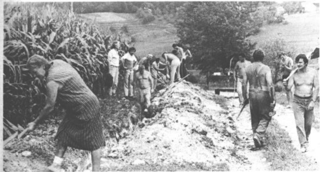
Svojo veliko delovno vnamo za uresničitev te zahtevne naloge krajani pokažejo z udeležbo na vsaki udarniški akciji. Prejšnjo nedeljo se je slednje udeležilo več kot 55 krajanov.

Naj končamo tole pripoved tako kot smo jo začeli... in prihodnjo pomlad bodo živeli v slogi, veselju, srečni in zadovoljni še dolgo let.