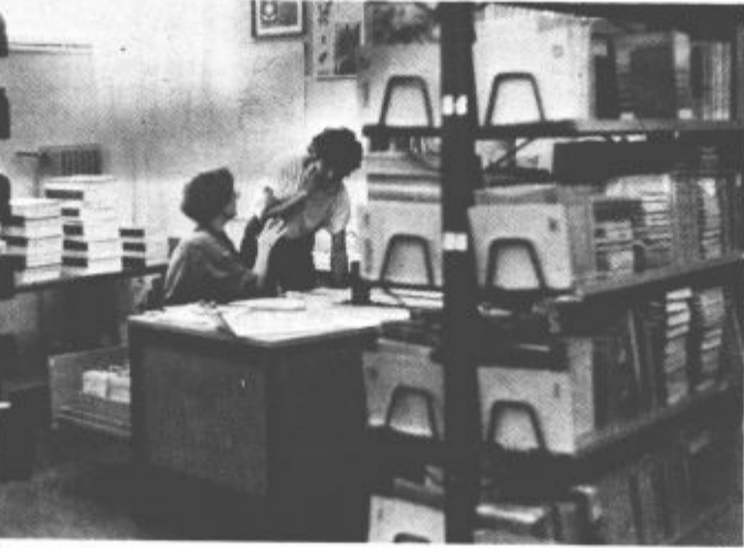
Med pridobitvami so tudi prostori za knjižnico