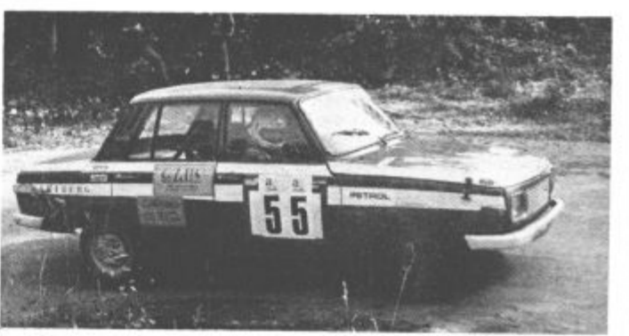
Posadka bratov Krištof na enem izmed tekmovanj

Stano Jelen iz Raven pri Soštanju gotovo prejšnji petek ni pomislil, da si bo medtem, ko bo sredi popoldneva kosil, nekdo prilastil njegovo motorno žago. Ko se je vrnil na delovišče, mu ni preostalo drugega, kot da je o kraji obvestil delavce postaje milice, ki neznanega dolgoprstneža še niso našli.