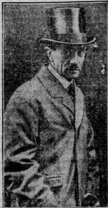
GROF PAVEL TELEKI.