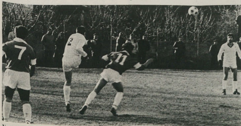
Vesna je v nedeljo doma remizirala z ekipo Zaule (0:0).