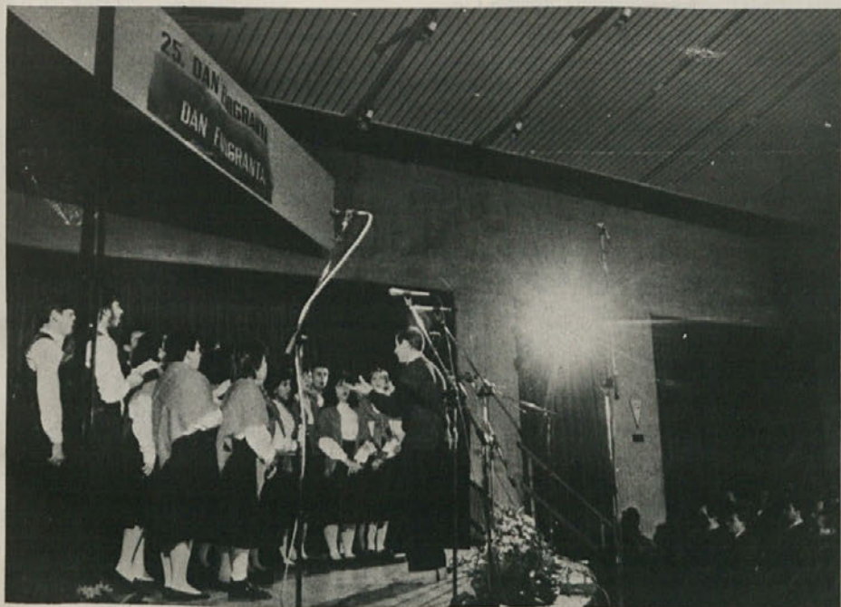
Slovenske organizacije iz Videmske pokrajine so v nedeljo 10. januarja priredile 25. dan emigranta.