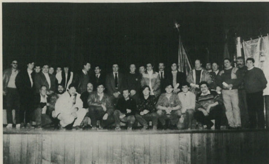
V občinskem gledališču «F. Prešeren» v Boljuncu so 18. decembra slovesno praznovali desetletnico ustanovitve Združenja prostovoljnih gasilcev «Breg».