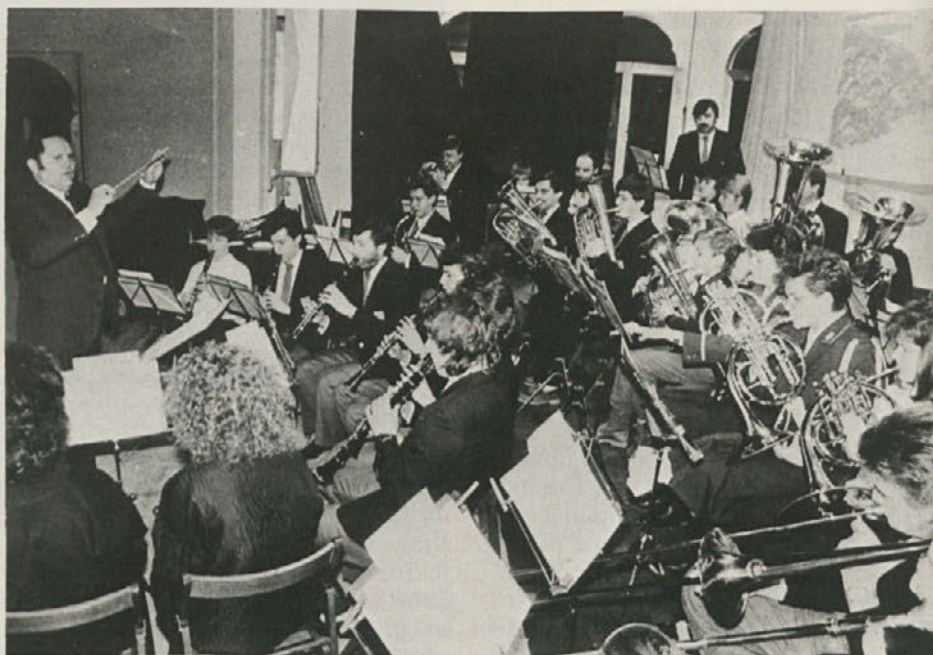
Vzhodnokraška godbeniška šola in godba «V. Parma» iz Trebč sta v nedeljo 10. januarja priredili koncert v Prosvetnem domu na Opčinah.

V tej situaciji je sleherni državljani prisiljen v samoiniciativo in torej v skrajno privatistično, partikularistično upravljanje svojih specifičnih dejavnosti oz. interesov. Pri tem so nekoordiniranost, nekomuniciranje, neizmenjava in skrajna razdrobljenost že ustaljena praksa, ki jo bo v prihodnosti vedno težje odpravljati. Popraševanje po kulturi je vedno bolj razdrobljeno; po drugi strani so ravno tako vedno bolj