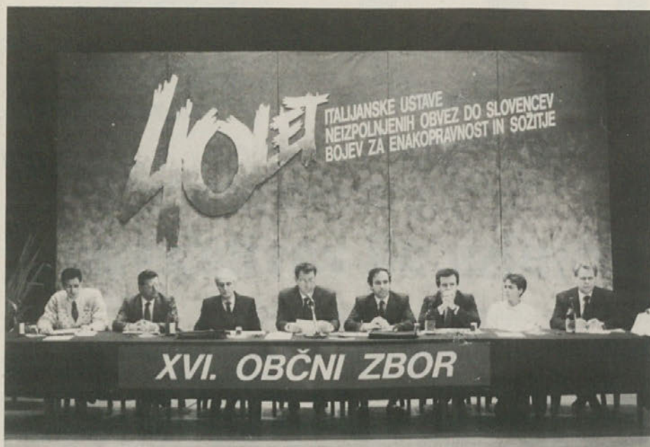
V Kulturnem domu v Gorici je bil 20. decembra 16. občni zbor SKGZ.

njegovo besedišče) odvisno, kje začrtati to «srednjo pot».