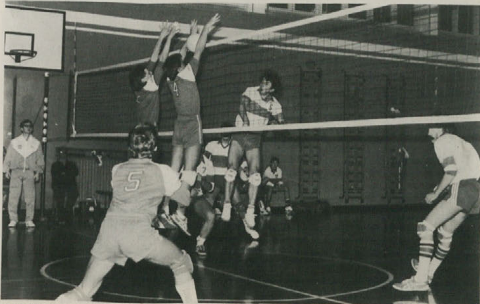
Sloga je 19. decembra gladko premagala naš prapor z rezultatom 3:0.

Še predno bi se spuščali v globljo, vsebinsko obravnavo, se mi osebno že takoj porajja preprosto vprašanje na katerega bi rada dobila tudi preprost in jasen odgovor. Na kateri osnovi lahko v naši državi načenjamo resno soočanje o reviziji ustave, ko pa nekatera njena temeljna načela (in ne mislim samo na člena 3 in 6) se v 40-letnem obdobju še niso konkretno uresničila?