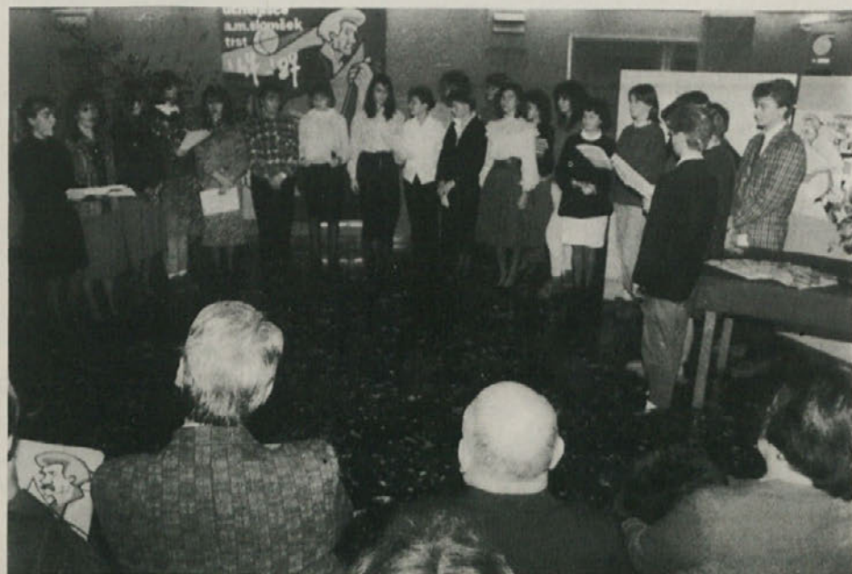
Proslava ob štiridesetletnici ustanovitve učiteljskega združenja «A.M. Slomšek».