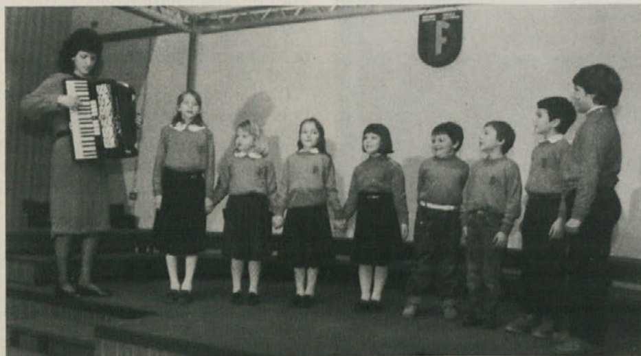
Otroški pevski zbor KD «F. Venturini» je 19. decembra v domu «Anton Ukmar» pri Domju prvič nastopil.

Pojem polivalentnosti je v tem kontekstu zgubil na vrednosti, saj je deželna vlada v teh letih zaustavila prepotrebno regulamentacijo polivalentnih organizacij. Kot posledica tega tudi današnje zakonsko besedilo premalo spoštuje in vrednoti pojem kulturne polivalentnosti. Kljub temu pa je osnovno