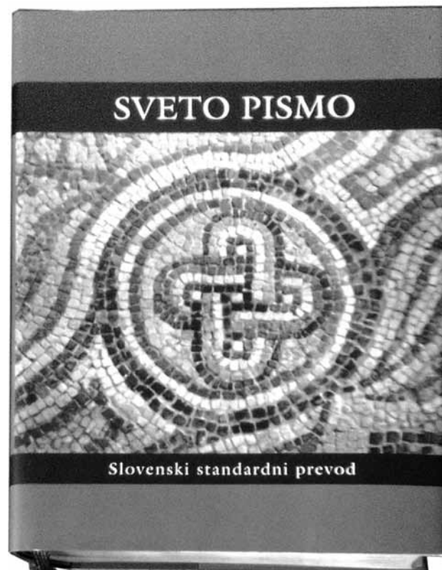
Sl. 1: Sveto pismo: Slovenski standardni prevod. Fig. 1: The Holy Bible: Slovene standard translation.

as mad as a hatter (pog.) – 'popolnoma nor', 'čisto nor'