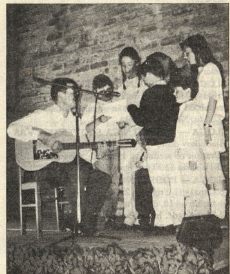
Ena izmed družin, ki so nastopile na prvem družinskem pevskem festivalu v Mendози.

Čeprav je za našo po številu majhno skupnost obisk sredi tedna tako velike skupine združen z velikim naporom in skrbjo, smo ugotovili, da je bil ves trud stoodstotno poplačan, ker je MPZ Musica viva iz Kranja pustil pri nas kvalitetno predstavo slovenske zborovske kulture.