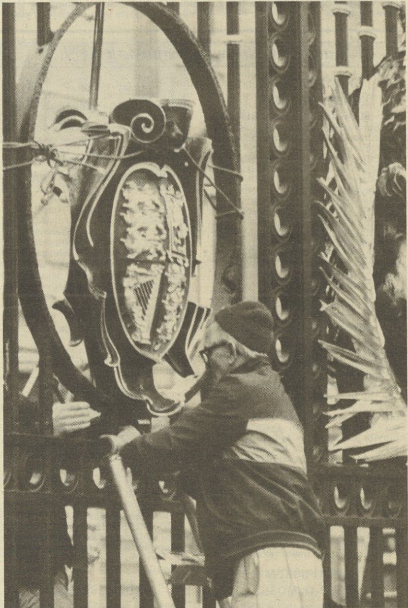
Delavec s posebno pozornostjo lošči grb iz medenine na vhodnih vratih Buckinghamske palače