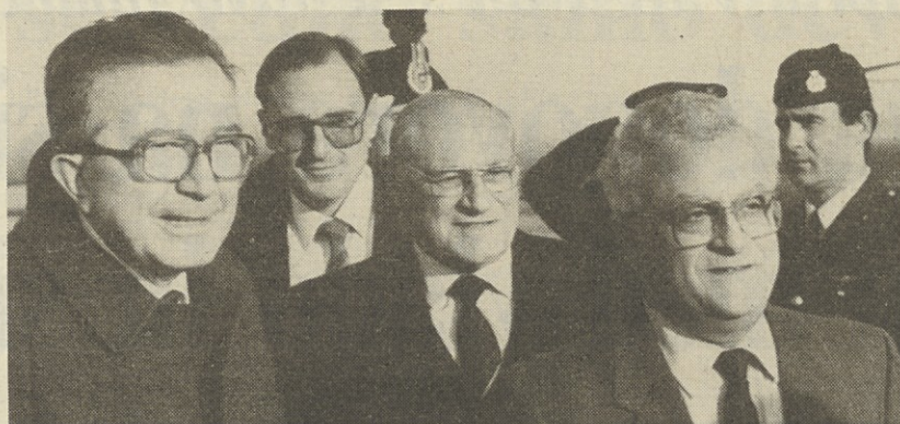
Včeraj je dopotoval v Rim predsednik malteške vlade Fenech Adami, ki ga je na letališču sprejel zunanji minister Andreotti