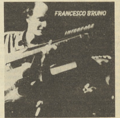
Pesmi albuma so: Jamaica, Interface, Frankenstein Alive, Japan, Stevie Stevie, Welcome, Big Digital Band, Data Error Fighters.

zelo zanimivi pa so jazz vložki, ki dajejo delu neko posebno noto. Interface je vsekakor zelo dobro posnet album in je prava priložnost za poslušanje nove in izredno dobre glasbe, ki se bo v kratkem času zelo razširila, plošča torej, ki jo je treba vsekakor poslušati.