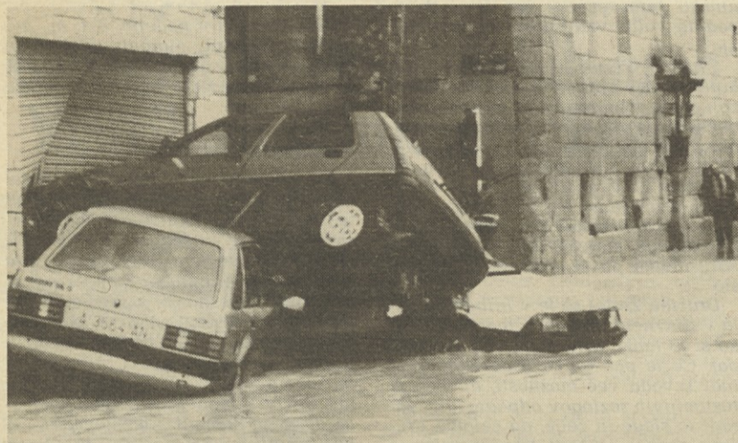
Narastle reke so v jugozahodni španski pokrajini Andaluziji prestopile bregove in povzročile veliko gmotno škodo. V prometnih nesrečah je umrlo osem oseb, dve pa sta se utopili