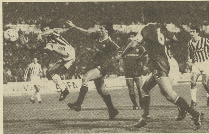
Napadalci Juventusa so se zaman trudili, da bi proti Panathinaikosu dosegli še četrti gol, s katerim bi izločili Grke

Pokal pokalnih prvakov - Le belgijski Malines si je uvrstitev v nadaljnje kolo zagotovil z zmago v gosteh,