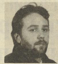
Pripravila: Boris Devetak

Film so predstavili na Beneškem festivalu istega leta kot Kusturičev Se spominjaš Dolly Bell in mu prav tako tudi podelili posebno nagrado žirije. Ob tem pa ohranja Hirszmanov film tudi druge sorodnosti in podobnosti s Kusturičevim prvcem, ki je tedaj prejel zlatega leva. Pri obeh gre za iskreno, privlačno in svežo politično dramo, ki prehaja in brezskrbne komedijske igrivosti, preko ironije tudi v resnejše, tragične tone. Kakor slikovito podaja bosanski režiser nostalgični proletarski izrez iz Sarajeva šesdesetih let, tako Hirszman predlaga sodobni portret revne delavske družine iz brazilskega vlemesta Sao Paulo, živo sliko, ki sega v intimne, zasebne razsežnosti, a tudi v ostre družbene konflikte, s katerimi se morajo spoprijeti razni družinski člani: trpeča mati, oče in sin, ki sta izpostavljena težkim delavskim razmeram, in drugi.