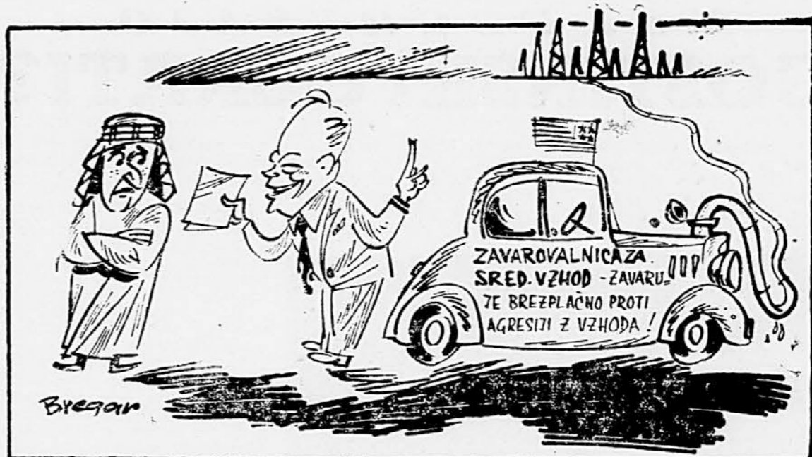
Prav! Toda kaj bo, če nas bo hotel kdo še proti Zahodu zavarovati...

no Afriko v OZN ali pod pokroviteljstvom te svetovne organizacije. Delegat Južnoafriške unije ni prisostvoval sestanku komiteja, ker meni, da je razprava o tem vprašanju smešna in v notranje zadeve države. Jugoslovanska delegacija je skupaj z nekaterimi delegacijami Latinsko-ameriških držav predložila posebnemu političnemu odboru Generalne skupščine resolucijo, v kateri ugotavlja, da se vlada Južnoafriške unije doslej še ni podredila sprejetim resolucijam za rešitev položaja prebivalstva indijskega izvora v Južnoafriški uniji.