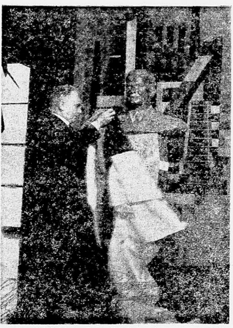
Ameriška misija v Beogradu

katerim načelom francoske diplomacije. Bivši predsednik britanske vlade Attlee je izjavil, da se strinja z načrti nove ameriške politike na Srednjem vzhodu. Izjavil je, da z novim programom ameriška vlada »zelo uspešno prevzema nase odgovornost tam, kjer je bila potrebna«. Glede usode Sueskega prekopa je Attlee izjavil, da je za internacionalizacijo te vodne poti, kakor tudi za internacionalizacijo Panamskega prekopa. Predsednik sirijske vlade Sabri Asali je izjavil, da je vlada zabele proučevala nedavne načrte predsednika ZDA o Srednjem vzhodu. Izjavil je, da bo vlada nadaljevala s proučevanjem sporočila na svojem prihodnjem sestanku. V tem času pa bo skupina visokih funkcionarjev ministristva za zunanje zadeve proučila ameriški dokument in o tem poročala ministristvu svetu. Ko je govoril na tiskovni konferenci, je premier Asali potrdil, da bo vlada kmalu imenovala delegacijo za