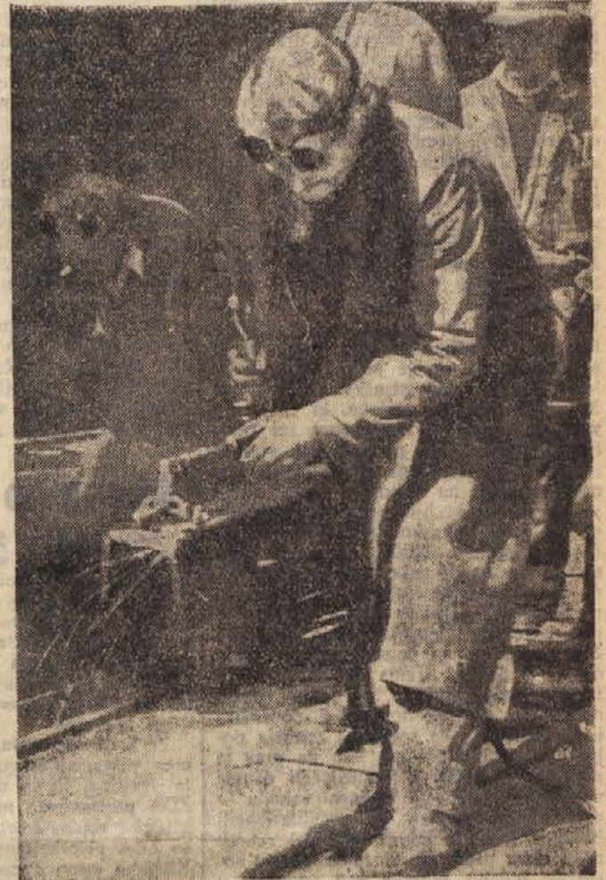
Tudi v kovinski industriji imamo udarnice. Na sliki: Udarnica pri avtogenskem rezanju v »Metalnici«

Da se tako naglo dviga število udarnikov, je vzrok predvsem v izboljševanju strokovne usposobljenosti in priučnosti delavcev, v boljši organizaciji dela, v stalnem naraščanju