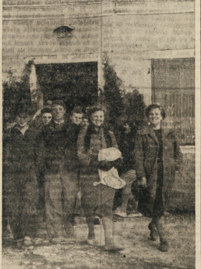
Na nedeljskih volitvah v con B Tržaškega ozemlja je mnogo mladincev in mladink prvič glasovalo, saj imajo volilno pravico vsi oni, ki so že prekoračili 18. leto starosti. Na sliki vidimo mladino iz Gažona, ki je s pesmijo pohitela na volišče in tam oddala svoj glas kandidatom, ki bodo poleg drugega skrbeli tudi za mladino.

V novi otroški telesni vzgoji opažamo, da ne gre toliko za umetno stilizirane drže in formalno predpisane gibe, tu di ne za izredne storitve, temveč za tiste gibalne naloge, ki so povezane z življenjem in s športnim delovanjem. Vtis ima, da je vse bolj naravno in neprimerno bolj radostno, kakor je bilo v preteklosti.