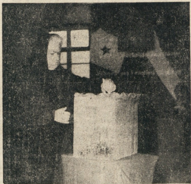
Volitev, ki so bile v nedeljo tudi na jugoslovanskem področju STO, so se polnoštevno udeležile tudi žene.

ce izločila iz socialnega okvira, bi njuno propadla. Propadla pa bi tudi socialna in nacionalna borba Slovencev, če bi se izključili iz splošne socialistične fronte, ki jo moramo ustvariti. Slovenske žene se morajo pri tem zavedati, da je prav v enotni obrambi socialnih pravic vključeno tudi nacionalno vprašanje in da je socializem tista osnova, ob kateri se rešujejo sama ob sebi tudi druga vprašanja. Če bomo sebe gradile v naprednem duhu, če bomo v naše vrste pritegovale vse delovne žene ne glede na nacionalne in politične razlike, le da so te žene pripravljene boriti se za skupne interese, potem smo lahko prepričane, da bo tudi naša nacionalna vprašanja pravilno rešeno.