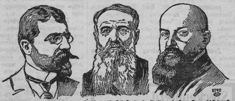
Dr. Danew, Bulgar. Ministerpräsident. Serbischer Min.-Präs. Pasich. H. v. Hartwig, Russ. Gesandter in Belgrad.

Dogodki na Balkanu vznemirjajo še vedno vso Evropo, zlasti ker so bulgarsko-srbsko grška nasprotja prekipevala do vrhunca. Naša slika kaže vodilne možje sedanje balkanske krize. Na levi strani vidimo bulgarskega ministerskega predsednika dr. Danew, ki se je izkazal kot izborni diplomat in ki je svoji domovini pač obilo koristi preskrbel. V sredini je slika srbskega ministerskega predsednika Pasica, ki je zaradi preteče vojne z Bulgarijo odstopil, a svojo demisijo zopet nazaj potegnil. O Pasicu je znano, da je popolnoma orodje v roki ruske politike. Prava nesreča in pravi demon za Srbijo in veš Balkan je ruski poslanik