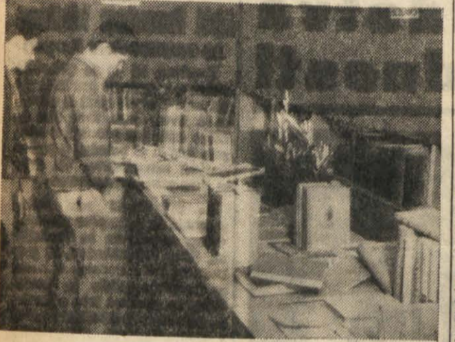
Razstava marksistične literature.