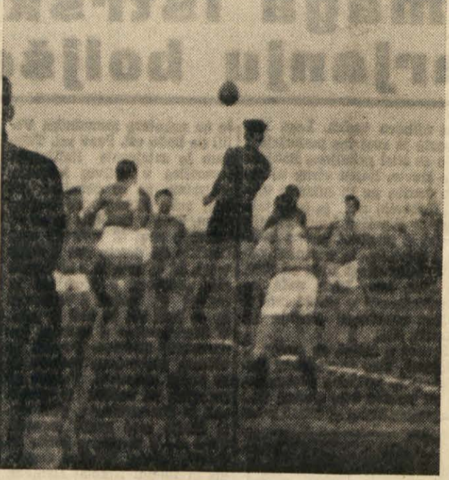
Prizor s tekme Montebello-Skedenj.

Montebello - Škedenj prekinjena v 26'. Zmaga Ilirije v okrožnem prvenstvu