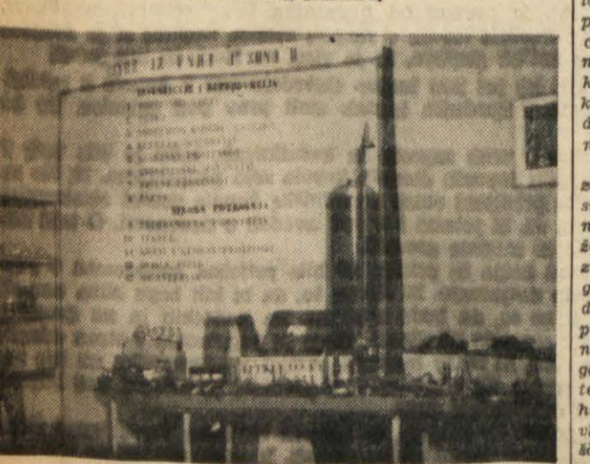
Razstava gospodarskega udejstvovanja Istrskega okrožja.