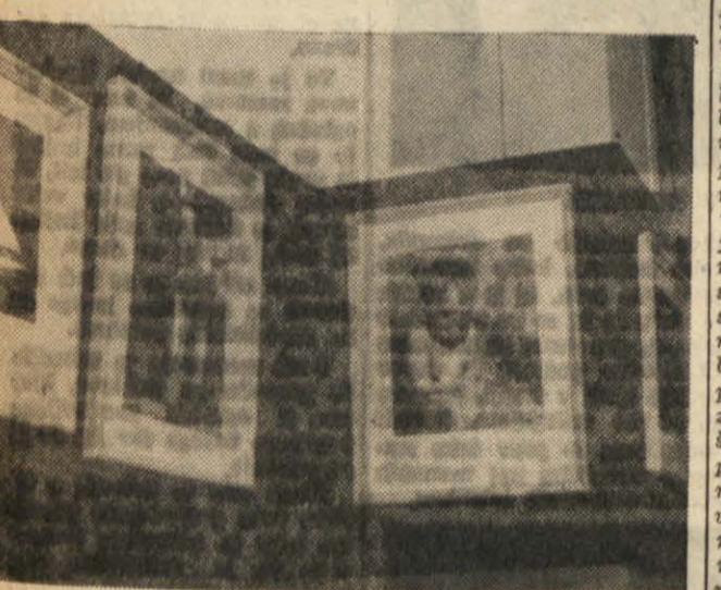
Razstava fotoamaterskih del.