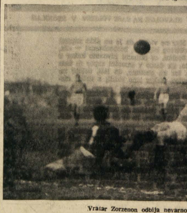
Vratar Zorzenon odbija nevarno žogo.

V petek zvečer so ponabli vrli barkovljanski prosvetarji v svojo sredo šahiste Ljudskega tednika, da bi ob tako estinih nasprotnikih lahko videli, kaj sami veljajo.