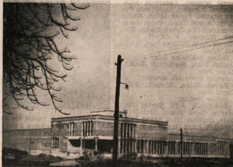
Objekt klavnice v Celju kljub težavam dobro napreduje

Drugače pa pripada delavcem centralnih obratov in sektorjem zaključnih del in montažnim skupinam terenski dodatek, določen v členu 11 pravilnika.