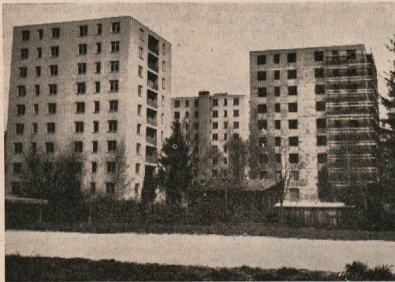
Stanovanja, grajena za tržišče so dobila svoje stanovalce. Ena od treh stolpnih na Otoku je predana svojemu namenu

veljavna za gradbene obrate (železokrivci, odri, maltarna in kamnolom SK), ki imajo isto dinamiko kot klasična gradnja.