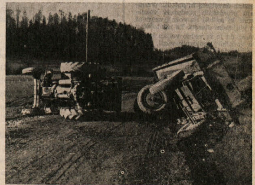
Ne samo materialna škoda, tudi človeška življenja so stalno ogrožena od nepredvidnih voznikov motornih vozil

Največ prometnih nesreč je bilo lani v celjski in žalski občini za ostale občine pa statistični pregled izkazuje naslednje podatke: