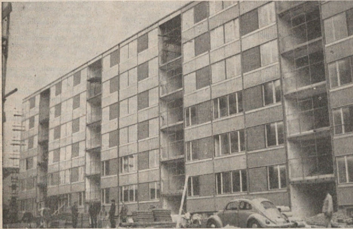
Prvo objekt montažne stanovanjske gradnje je v zaključni fazi. Le še nekaj dni in težko pričakovana stanovanja bodo pripravljena za vselitev

va projekta, konstrukcije ter končna obdelava objekta. Odpa-dejo razni posredniki, hkrati pa nalaga tudi več dolžnosti in odgovornosti.