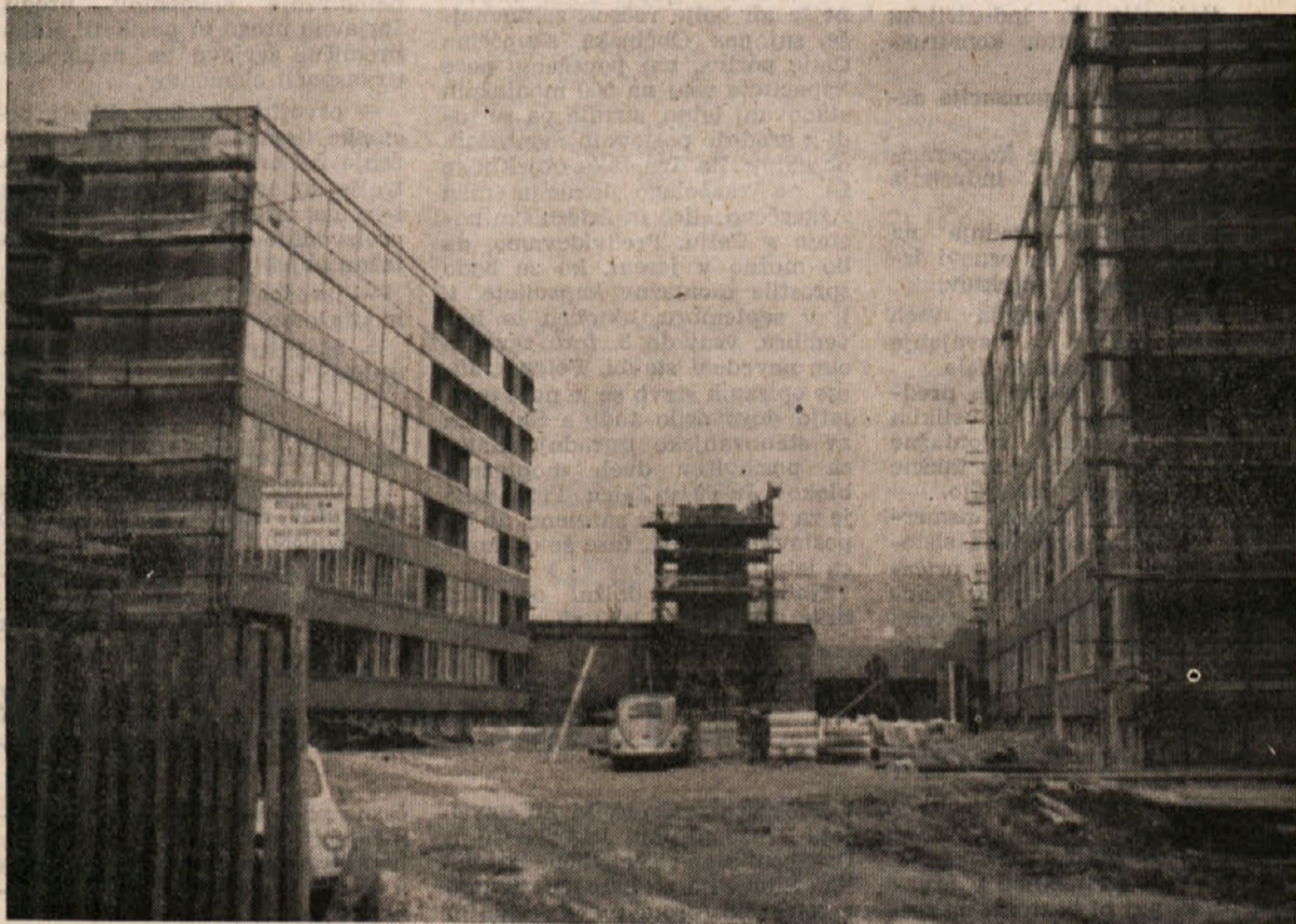
Otok II v Celju je postal eno naših največjih gradbišč. Montažni stanovanjski bloki »rastejo« kot gobe po dežju

samezne gradnje za tržišče se višina potreb med letom menja. Primanjkljaji se krijejo z avansi investitorjev.