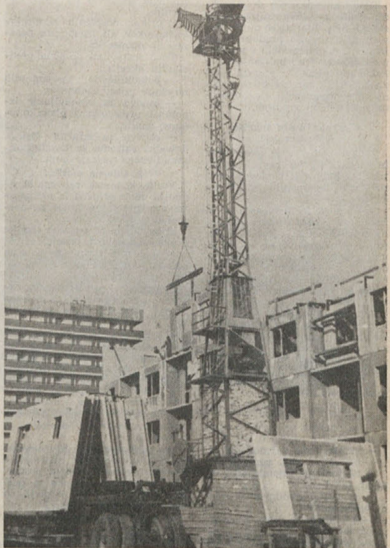
Brez težke mehanizacije ni mogoča montažna gradnja. Na sliki vidimo težki žerjav pri prenašanju montažnih plošč