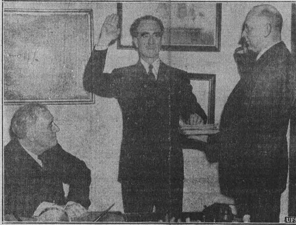
Frank Murphy, bivši guverner države Michigan, polaga vpricho predsednika Roosevelta prisego kot novi justični tajnik Zedinjenih držav.