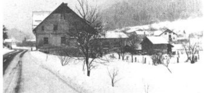
Krajane Doliča čaka letos prav toliko, ali pa še več nalog kot lani

Seveda pa bi razvoj bil še vidnejši, če se okoli 80 odstotkov delavcev ne bi vsak dan vozilo na delo v sosednjo velenjsko občino. Delovne organizacije, v katerih so zaposleni, pa ponavadi preslišijo želje krajevne skupnosti Dolič, čeprav ob tem v Doliču s ponosom povedo, da uspešno sodelujejo z Rekom. La-