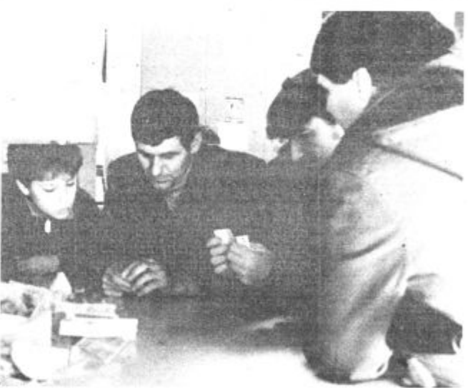
Bo — ne bo? V teh listkih je pisalo: Brez dobitka.