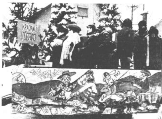
Šoštanjčani so se letos karnevala lotili prvič. Bili so v središču dogajanja, pa so »skuhali« volilni golaž. Seveda se niso mogli izogniti tudi onesnaženega okolja.