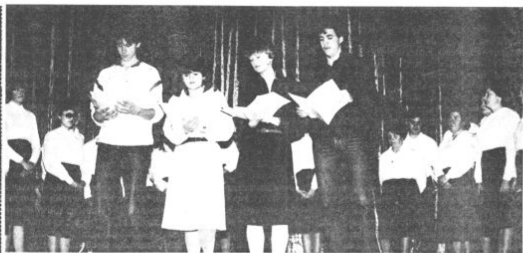
Zapelo je 163 pevcev