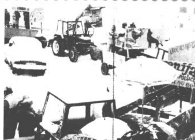
Topolščanom je največji problem trgovina oziroma kozarec vode v Našem času. Kar z lučjo jo iščejo in to celo podnevi- Glavno ulico imajo namreč pogosto razsvetljeno do poznih dopoldanskih ur.

V nedeljo so imeli pustna karnevala še v Topolšici in v Šoštanjju.