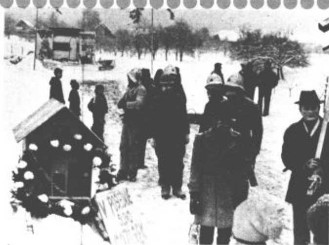
Škalske šeme (pa tudi Hrastovške) so si zaželele nov gasilski dom (Bog ne daj, da bi se imenoval drugače), postavile pa so tudi trgovino

Iz tega izhaja, da je peš pot sestavni del zunanje ureditve in je v upravljanju ter vzdrževanju hišnih svetov Stantetova 18-24 in 26/32.