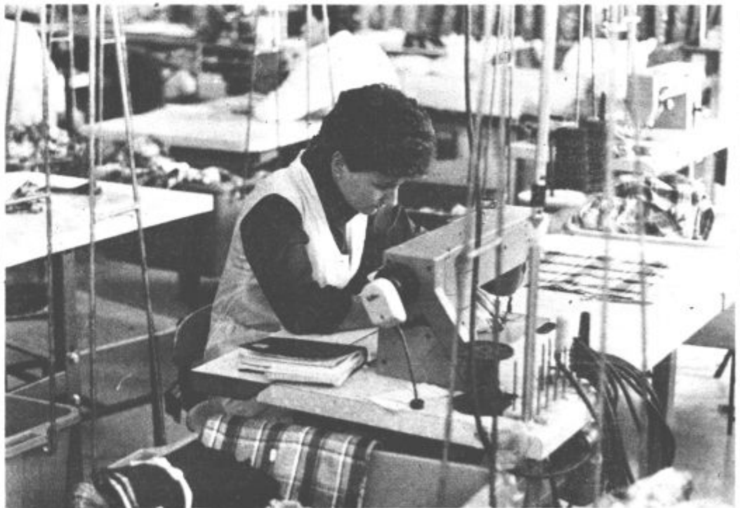
Kakšno prihodnost si kujemo?

Nanizali smo le nekaj problemov, s katerimi se srečujemo v občini Velenje. Za kar vse pa bi lahko rekli, da so tako pereči, da jih je treba takoj odpraviti, da je treba takoj predvideti njihovo razrešitev. To bi bilo seveda najbolje, žal pa to ni mogoče. Denarja za uresničitev vsega tega bo odločno premalo in iz naših programov bomo morali marsikaj črtati. Kaj je tisto, kar najbolj potrebujemo in kaj je tisto kar bomo preložili na kasnejši čas pa je vprašanje, ki ga moramo doreči v času javne razprave o planskih dokumentih. Od nas vseh je odvisno, kako se bomo odločili, kaj bomo opredelili kot prioriteto. Zato je prav, da se vključimo v razpravo in prispevamo, da bodo naši planski dokumenti kvalitetni oblikovalec naše prihodnosti. (mz)