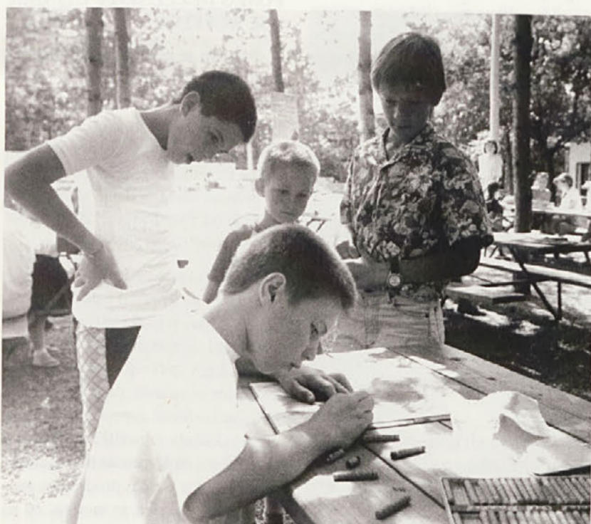
Vaška skupnost Praprotnje je 19., 20. in 21. junija priredila 19. šagro v Praprotnu. Na sliki: Otroški ex-tempore.