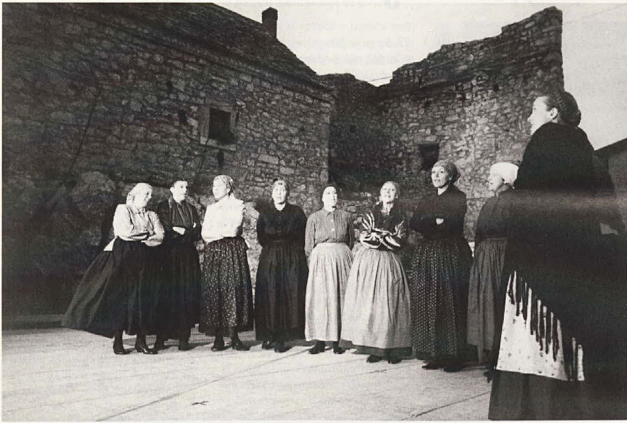
Tržaška folklorna skupina Stu ledi , je v soboto, 26. junija proslavila 20. letnico obstoja in aktivnega delovanja.