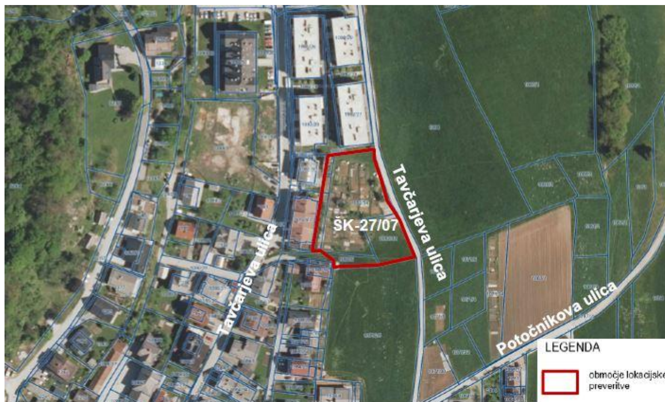
Priloga: Grafični prikaz območja.