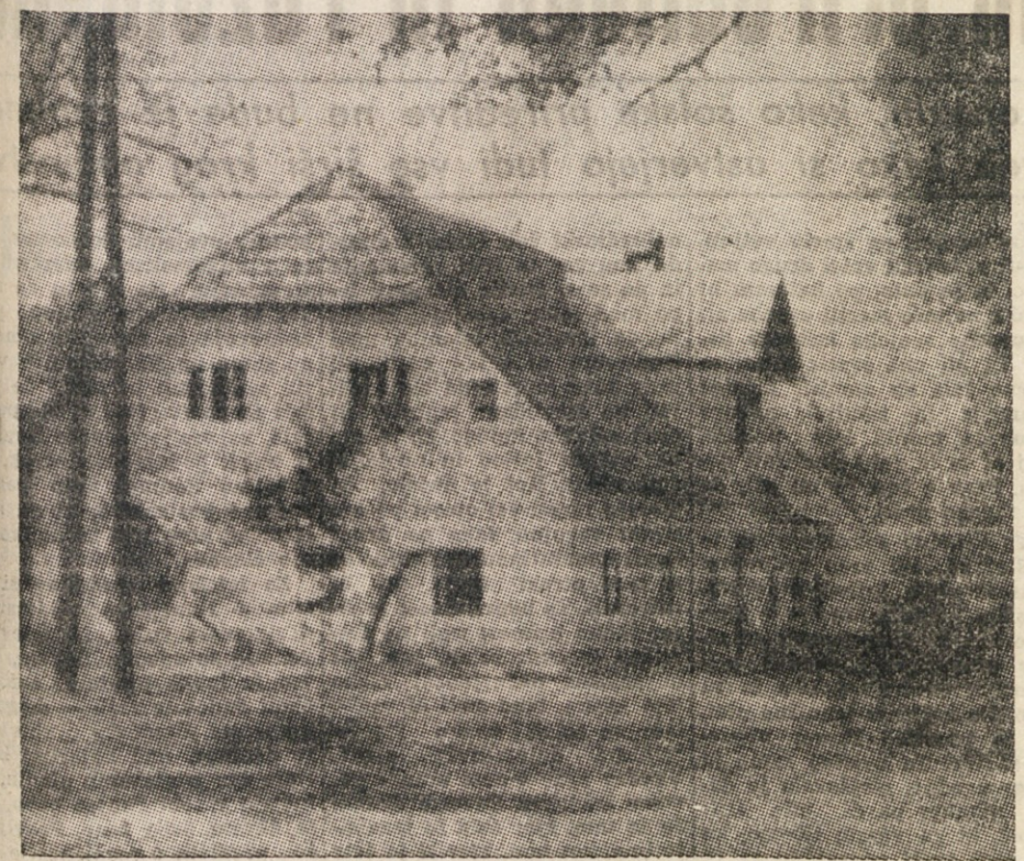
V Svatnih pri St. Jakobu v Rožu na Koroškem še stoji hiša, ki je bila dom junakinje Miklove Zale. Slovensko narodno gledališče bo uprizorilo znano ljudsko igro Miklovo Zalo na Stadionu v petek 26. t.m.; ponovitev bodo do drugega petka