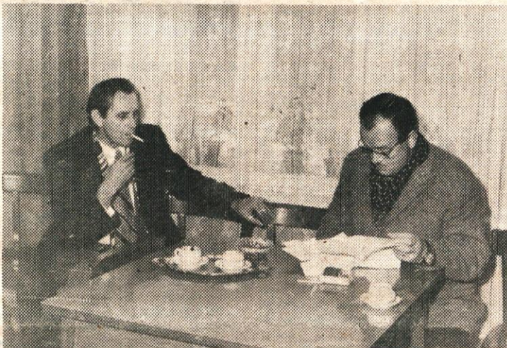
OB ZADNJIH VOLITVAH V SAMOUPRAVNE INTERESNE SKUPNOSTI