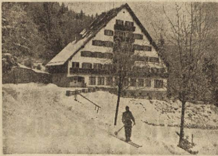
Te dni, ko je mraz malce popustil, se najbolj vneti ljubitelji belega športa, posebno še tisti, ki delajo načrte, kako bodo del dopusta izkoristili za smučanje, že kar boje, da ho sneg prehitro skopnel. — Na sliki je Poštarski dom na Pohorju, ki je s smučarji v bližnji okolici smučarjem prav priljubljen.

V Postojni bo treba misliti tudi na gradnjo nove gimnazije. Govori se celo o tem, da bodo morali ukiniti glasbeno šolo zaradi pomanjkanja prostora. Postojna, čeprav je središče, nima kulturnega doma. Sredi Postojne sicer stoji nekaj kulturnemu domu podobnega, vendar je urejen tako, da ga je nemogoče uporabljati, zlasti ne pozimi. S. L.