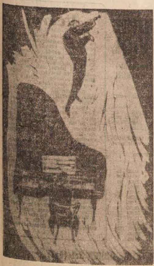
Jakčeva grafika »Koncert« je na razstavi jugoslovanske grafike v Beogradu vzbudila med občinstvom in kritiki zaradi svoje umetniške sile veliko zanimanja. Božidarja Jakca so kritiki po pravici nazvali pionirja te vrste umetnosti.