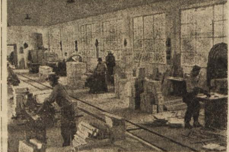
Tovarna splošnega pohištva v Cerknici je opremljena s najmodernejšimi stroji. Uspela je predvsem s pohištvom iz mehkega lesa, katerega 80 % izvaja. Prodaja ga v Ameriko, Anglijo, Italijo, Francijo, Nemčijo in na Bliznji vzhod. Težave pa imajo v tovarni še vedno zaradi nekvalificiranih delavcev. Zato so sklenili, da bodo morali vsi delati strokovne izpite.

Ob zaključku je bil izvoljen nov občinski komitej ZK