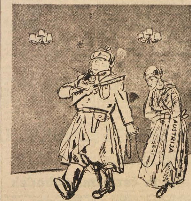
Predlog Molotova in avstrijsko vprašanje

Socialno demokratski senatorji groze z razkolom v sedanji stavkovni akciji, ki so jo sprožili skupaj s kominformovsko generalno federacijo dela, češ da slednja vnaša politične protivladne elemente v stavko, ki da bi morala biti čisto gospodarska. Kolikor bi prišlo do razkola, se bodo socialnodemokratska sindikati najbrž pridružili demokristjanskim sindikalni organizaciji, ki se že pogaja s konfederacijo industrijscev o zvišanju plač.