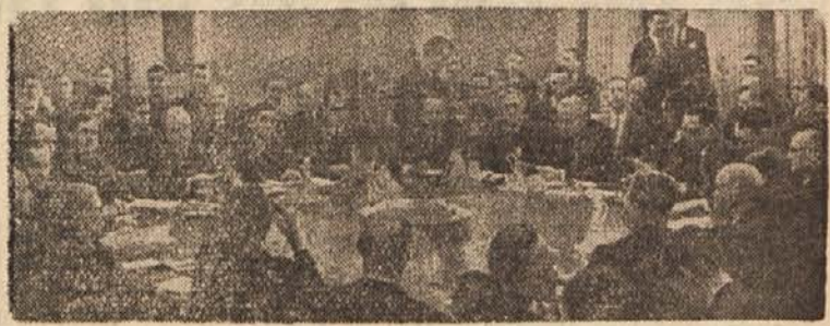
Med konferenco v vzhodnem Berlinu

Drugi teden je bil teden propagandističnih licitacij v zvezi z Nemčijo in evropsko javnostjo. Poln je bil dolgih propagandnih govorov. Prevladovali so besedni dvoboji Mo-