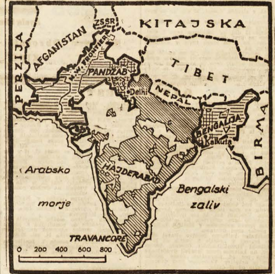
Vodoravne črte kažejo muslimansko ozemlje, ki je nesporno. Kvadrataste črte kažejo ozemlje, ki ga zahteva muslimanska liga, kongres pa temu nasprotuje. Poševne črte kažejo ozemlje, poseljeno s Hindi (Hindustan). Bela polja pomenijo države princev (Rajistan).

Reprezentanti Budimpešte sta premagali »Crveno zvezdo«. V Beogradu sta gostovali moška in ženska reprezentanca Budimpešte v kosarki. Igrali sta proti odgovarjajočim ekipam »Crvene zvezde«. Budimpešta je zmagala v srečanju ženskih ekip 42:9, v srečanju moških ekip 40:33 (31:17).