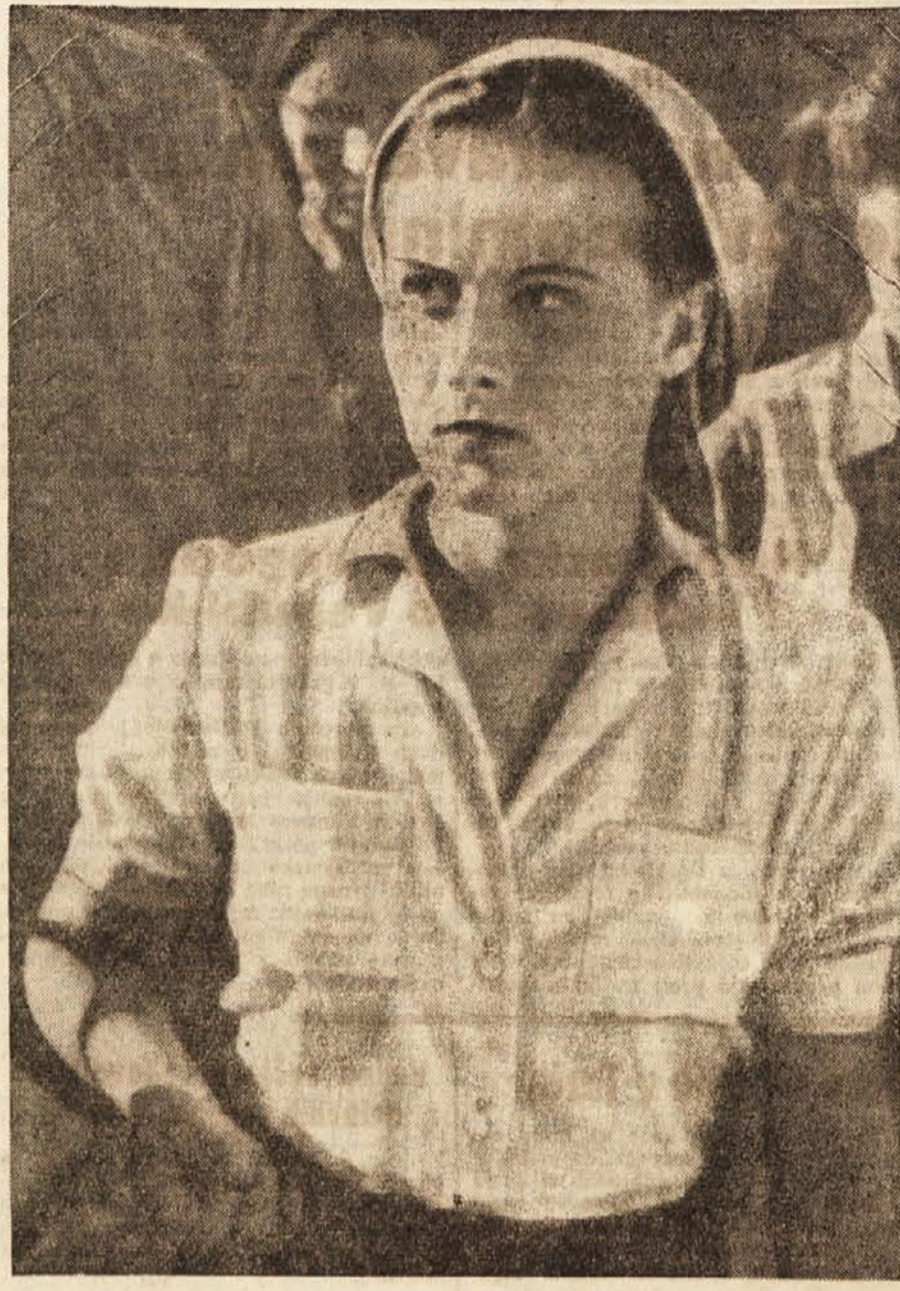
PREMIERA PRVEGA JUGOSLOVANSKEGA UMETNIŠKEGA FILMA

POSJOJILA ZA NABAVO KURJAVE Mestna hranilnica v Ljubljani bo tudi letos v smislu določil Uredbe z dne 3. 4. 1947 dovoljevala posojila za nabavo kurjave proti 6 mesečnemu odplačilu in znižani obrestni meri 4% do največ 2000 din. Sporazumno z DZS, centralo Narodne banke za LRS ter Naprozo v Ljubljani bo te kredite za Ljubljano in okolico podeljevala le Mestna hranilnica Ljubljanska. Da se postopek pri podeljevanju čim bolj poenostavi in da se prepreči izguba delovnega časa za posamezne prosilce, se bo izvedlo to kreditiranje za aktivne namestece in delavce preko njihovih sindikalnih podružnic, ki bodo dobile od glavnega odbora ES oziroma Mestne hranilnice vsa potrebna navodila. Vpokojenci in drugi potrošniki, ki niso člani sindikatov, naj se za kredit obrnejo naravnost na Mestno hranilnico, kjer dobe potrebna navodila ter tiskovine.