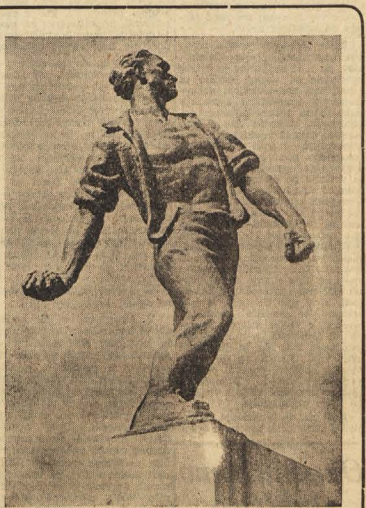
DANES, NA DAN MRTVIH, SE SPOMINJAMO ZLASTI NAŠIH BORCEV, TALCEV IN DRUGIH ŽRTEV FASISTIČNEGA TERORJA, KI SO V NESEBICNI LJUBEZNI DO DOMOVINE DALI ZANJO NAJVEČ, KAR SO IMELI - SVOJA ŽIVLJENJA. — NA SLIKI: SPOMENIK PADLIM BORCEM V SLOVENSKI BISTRICI: BOMBAŠ — DELO POKOJNEGA AKADEMSKEGA SLIKARJA LOJZETA LAVRIČA

Na vprašanje, ali je kolonializem prevladujoče vprašanje na letošnjem zasedanju Generalne skupščine Združenih narodov in