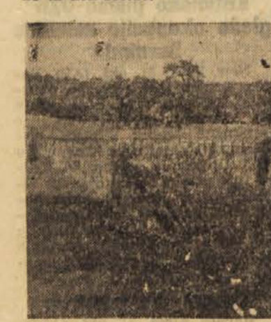
Večkrat potujem iz Ljubljane proti Reki in kadarkoli ugledam malo pred Pivko grobnico 35 padlih partizanov, oddaljeno 50 metrov od glavne ceste, se razležim nad malomarnostjo prebivalcev, ki niso mogli še sedaj, deset let po osvoboditvi, urediti grobnice, kot se spodobi. B. Z.

V tovarni trikotarje »Andja Ranković« so uredili to vprašanje samo na pol. V restavraciji, kjer se razlega iz zvočnika glasba, se zbirajo delavci okrog miz, jedjo svojo hrano ali pa hrano, kupljeno v restavraciji. V restavraciji lahko dobiš samo mrzle jedi: salamo, jogurt, sir, sendvič in podobno. Cene so nižje kot v mestnih mlečnih restavracijah. Prodajalko plačuje podjetje, ki je prevzelo tudi ostale stroške. Stroški so minimalni, tako da plačujejo delavci vrednost živil brez marže v prodaji na drobno. Vse to je glede na možnosti podjetja preveč skromno in nezadostno.