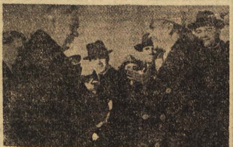
U Nu v Moskvi. Na letališču ga je pozdravil predsednik vlade maršal Bulganin

Pjongjang, 31. okt. (Nova Kitajska). Severnokorejska in japonska parlamentarna delegacija sta objavili skupno poročilo, ki v njem zahtevata vse potrebne ukrepe za normaliziranje stikov med Japonsko in Severno Korejo.