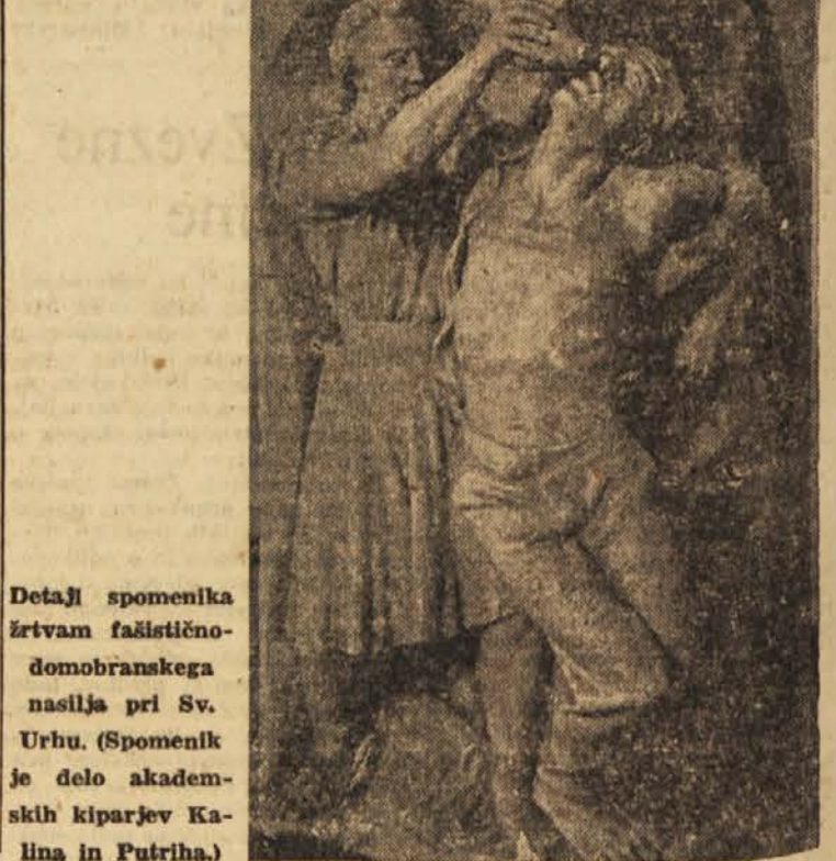
Detalji spomenika žrtvam fašističnodomobranskega nasilja pri Sv. Urhu. (Spomenik je delo akademskih kiparjev Kallina in Putriha.)