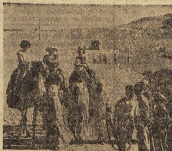
Turisti pri piramidah

Turisti prihajajo in odhajajo, piramide pa stojijo tihe in nepremične, Sfinga zre proti vzhodu, kakor je zrla takrat, ko je stal ob njenem vznožju monoteistični reformator Akenaton ter na meji med bujno kipečim življe-