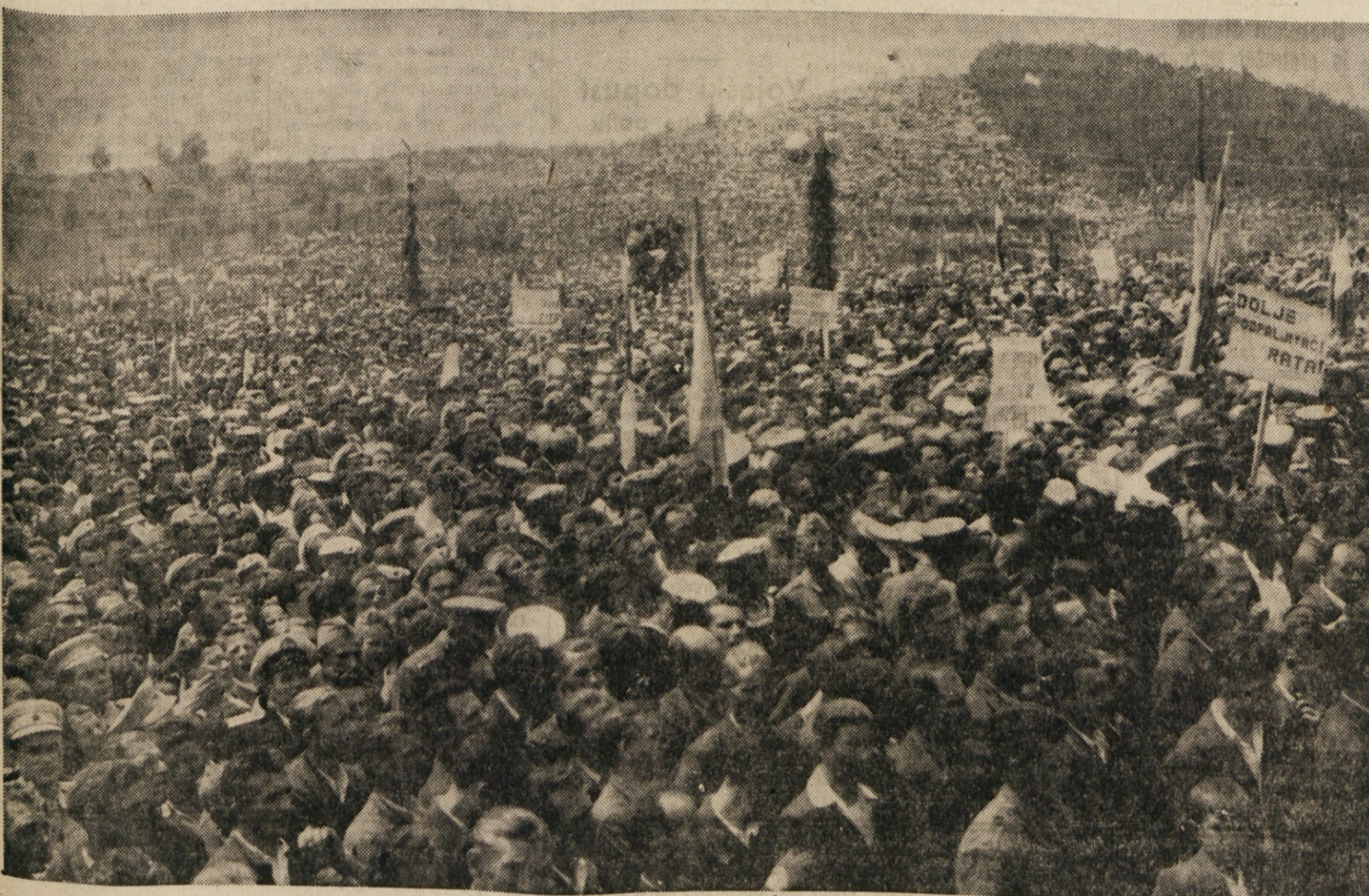
Istrsko ljudstvo posluša govor predsednika FLRJ maršala Tita pri Bermu, rojstnem kraju Vladimira Gortana