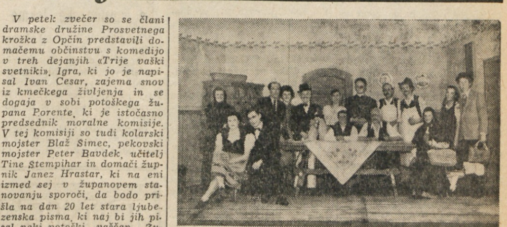
Članj dramske družine Prosveitnega krožka z Opčin so pretekli petek z velikim uspehom predvajali komedijo v treh dejanjih «Trije vaški svetniki»