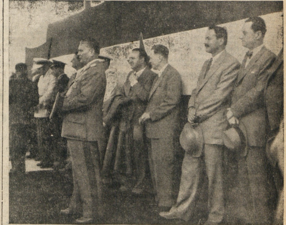
Predsednik FLRJ tov. Tito pred začetkom govora na častni tribuni. Za njim stojijo od desne proti levi podtajnik za zunanje zadeve dr. Aleš Bebler, predsednik vlade LRH Crne gore Blažo Jovanović, predsednik vlade LRS Miha Marinko in predsednik vlade LRH Vladimir Bakarić.

Nam sicer neke hribe, s katerimi se kamenje ruši v dolino. Dali bi nam to in pokamnilo liho malo tja. Toda nam ni treba kamenja. Vse to ozemlje je našo. Tu žive naši ljudje, četudi žive tudi Italijani, toda 13 stoletij je od tega, odkar so naši ljudje prišli v Zavljive in Skedenj. Italijani so prišli tja šele 1918, oziroma 1920 leta, Nikolai bil Trst njihov. Tu so bili Bizantinci, Franki, Nemci in kaj vem kdo vse. Italijani nikdar niso imeli Trsta, čeprav je bilo v njem precej Italijanov in čeprav se je italijanski zvezdel vedno bolj naseljeval. Trst je del našega nacionalnega ozemlja. Zato ni govora o tem, da bi pristali na to, da bi kot baza za razgovore o rešitvi tržaškega vprašanja mogel služiti predlog De Gasperi in italijanske vlade.