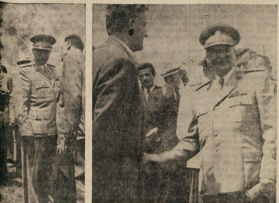
Maršal Tito se rokuje s tov. Deklevo in s tov. Stoko, ki se mu zahvaljujeta za njegove odločne besede, ki jih je izrekel o tržaskem vprašanju