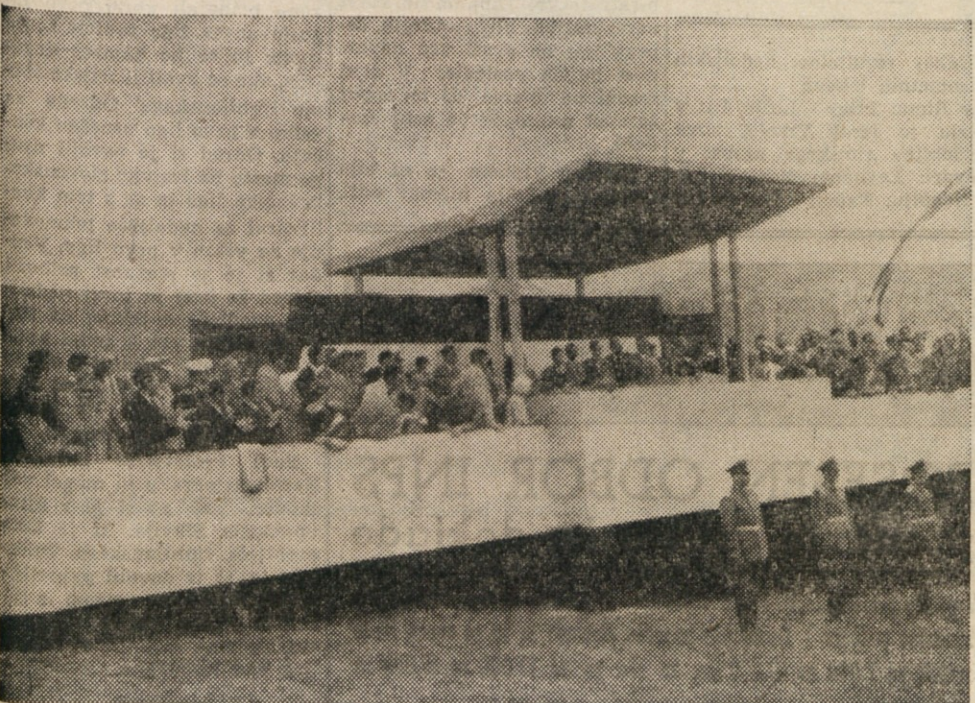
Castna tribuna, s katere je tov. Tito govoril množici ob odkritju spomenika Vladimiru Gortanu