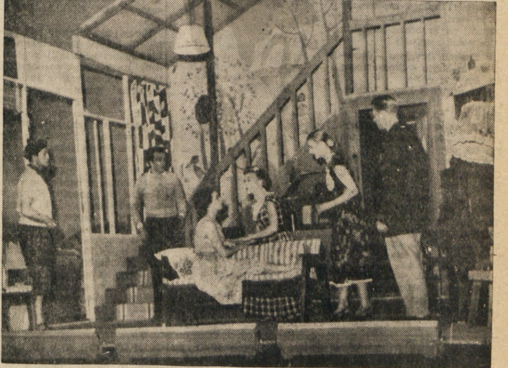
Prizor iz zadnjega dejanja Pugetove komedije «Srečni doživji» v aprizoritvi Mestnega gledališča v nedeljo v Avditoriju