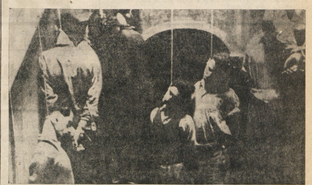
Kot gost tržške «Socialistične stranke della Venezia Giulia» se v Trstu mudil mednarodna socialistična komisija, ki naj prouči tržasko vprašanje. Prepričani smo, da jih njihovi gostitelji ne bodo peljali ogledati si tudi tiste kraje, ki so za tržasko prebivalstvo zgodovinski. Zato jim bomo mi nudili nekaj kratkih toda izredno važnih pojasnij. Naša slika prikazuje strahoten nacifasistični zločin v Ul. Ghega, kjer so nacisti 23. aprila leta 1944 obesili 51 talcev, antifasistov, ki se niso spuščili v razna plebsicitarra reševanja tržškega vprašanja, ampak so s svojo borbo odločno povedali, da hočejo živeti svobodno na svojih tleh