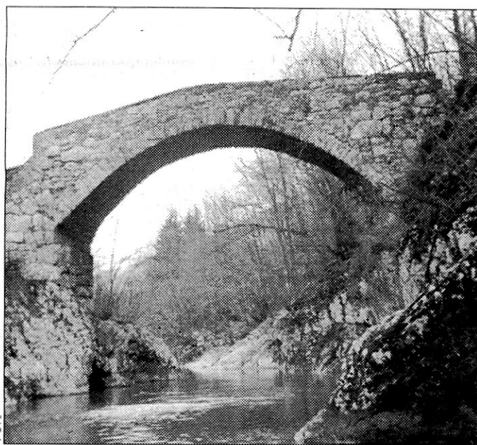
Po ustnem izročilu naj bi most izviral iz rimskih časov.

V hotelskem ceniku na 68 straneh po abecedi krajev najdemo poleg cen za prenočevanje z ali brez zajtrka, doplačila za polpenzion oziroma penzion v eno- ali dvoposteljnih hotelskih sobah in apartmajih še vrsto koristnih informacij o ponudbi krajev in gostinskih obratov. V ceniku kampov so poleg cen objavljene njihove telefonske številke in čas obratovanja.