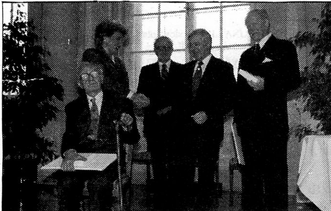
Štirje srebrni častni znaki svobode pred kulturnim praznikom.