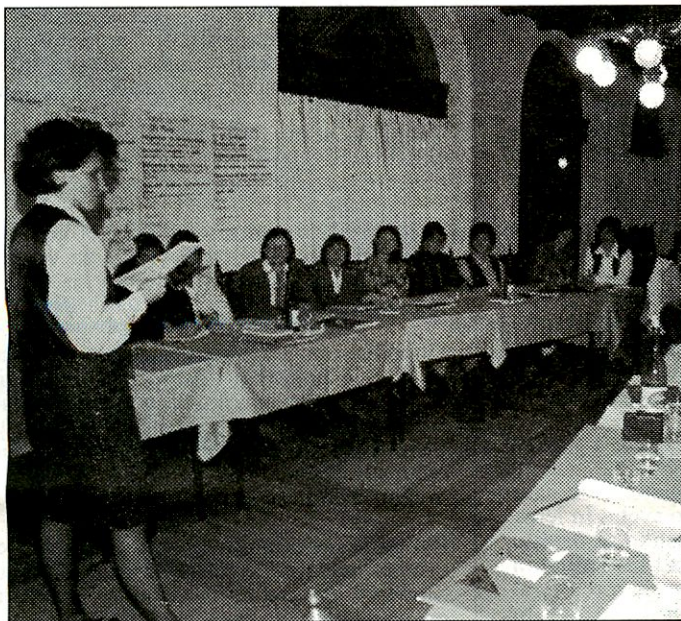
Učiteljice na seminarju

predstavila program in metode dela. Dobile so navodila za delo in se spoznavale ob socialnih igrah. Hospitirale so na OS Šentrupert, v Mirni na razredni stopnji ter pri pouku slovenskega jezika, zgodovine in geografije na predmetni stopnji na OS Dolenjske Toplice. Ukvarjale so se s funkcionalno rabo slovenščine, socialnimi igrami pri pouku ter umetnostnim besedilom. Srečale so se tudi s pesnikom Tonetom Pavčkom, govorile so o bogatenju besednega zaklada in kreativnem pisanju. Pogovore so spremljale tudi delavnice.