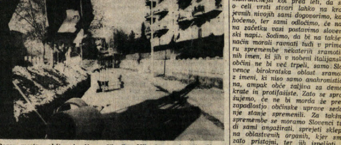
Bager mestne občine koplje v Ul. Sv. Mihaela za kanalizacijo v Štandrežu

V noči od sobote na nedeljo, kmalu po polnoči, je prišlo na ločniškem mostu čez Sočo do silovitega trčenja dveh avtomobilov, pri katerem sta obe vozili utrpeli zelo veliki škodo. K sreči pa so bili trije potniki v njih le lažje ranjeni.