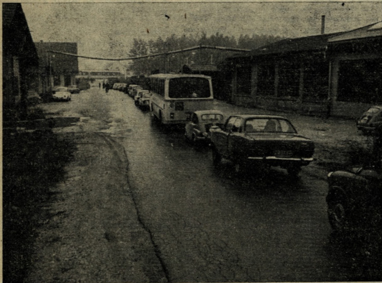
Cestni zamašek pred zapornicami na cesti za Jakob