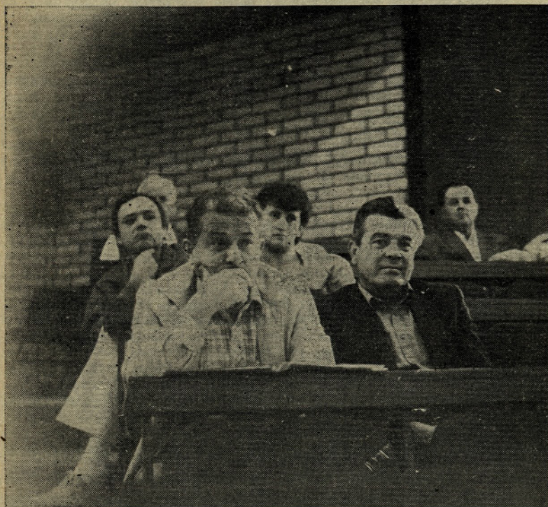
ZASKRBLJENOST PRED NOVIMI NALOGAMI