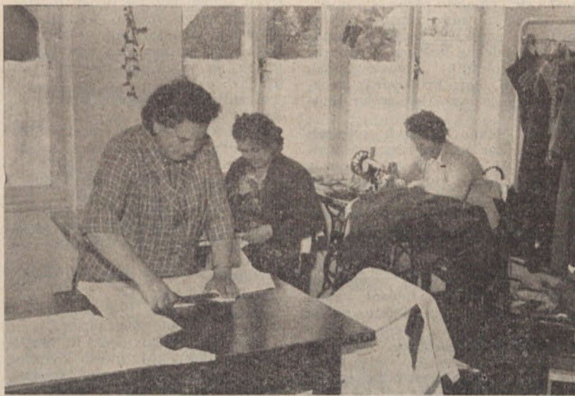
Šivalnica v Perčevi ulici 22

praznili garaže, ki jih sedaj oddajajo, in v njih uredili več delavnic. Skušali bodo po svojih močeh uresničiti zamisel o ustanovitvi skupnega gospodarskega servisa za območje mesta Ljubljane. Ta naj bi opravljal vse mogoče usluge s področja gospodinjstva,