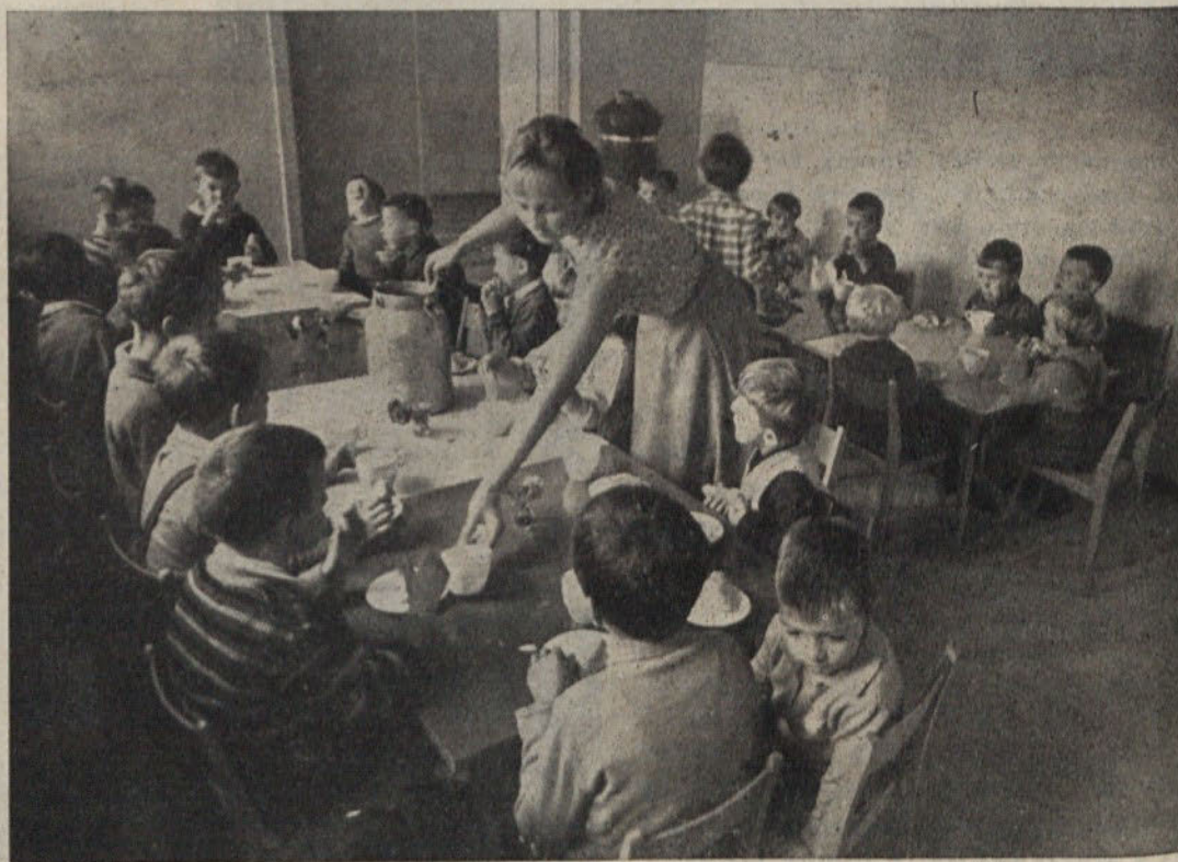
Od 1. septembra je spet odprt otroški vrtec pri stanovanjski skupnosti Kodeljevo. Otroci so v vrtcu od pol šestih zjutraj do treh popoldne, kjer dobe tudi dopoldansko malico in kosilo. Dnevni red je izpolnjen s primerno zaposlitvijo, igrami, telovadbo in daljšimi sprehodi. Na posnetku vidimo prebivalce otroškega vrtea pri dopoldanski malici

Delo 8 Svobod in prosvetnih društev povezuje svet za šolstvo, prosveto in kulturo — svet svobode in prosvetnih društev še ni ustanovljen. Ustvarjajo pa že sama društva široko mrežo prosvetnega in izobraževalnega dela. A prav dosedanje dejavnosti kliče po nujnem dviganju kvalitete in iskanju nove vsebine in oblik v aktivnosti društev in posameznikov. Za zdaj sta bili v ospredju glasbena in dramska sekcija, sodobni razvoj pa že kar zahteva čimširšo organizacijo klubov in sekcij, ki naj bi skrbele za izobraževanje in razvedrilo. Pomoč takim težnjam se mora odražati tudi v primernejši participaciji v proračunu, kakor seveda ne gre zagovarjati nekaterih prekomernih dotacij za to dejavnost. Velika sredstva, naložena v preteklih letih v objekte za kulturno-prosvetno delo v občini, naj bodo seveda izkoriščena in naj ljudskoprosvetni delavci vsklajajo svojo dejavnost z željami in potrebami občanov — pa bo imel ljudski odbor tudi iverje razumevanje za vse te dejavnosti.