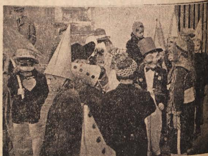
Veseli pustni dnevi so zdaj za nami