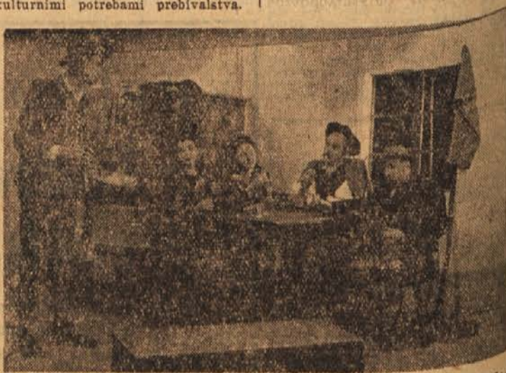
Prizor iz igre »Dve nevesti«, ki jo je uprizorilo okrajno gledališče v Ptuj

Štiri Svobode so priredile v pretekli sezoni 78 gledaliških predstav, 23 pevskih in godbenih koncertov ter nad 20 raznih predavanj. Vse našteje prireditve je obiskalo približno 25.000 ljudi. To pomeni, da imajo delavskoprosvedna društva zelo velik pomen za kulturnoprosvedno in politično vzgojno preobrazbo članstva in ostalega prebivalstva. Delo društev pa je zelo oteženo, ker nimajo ustrežajočih družbenih prostorov in dvoran in ker jim zelo primanjkuje denarja. Res, da društva uživajo podporo mestne občine, vendar bi po splošnem mnenju morala tudi sama še bolj skrbeti za svoj razmah, zlasti bi morala stremeti, da bi povečala število članstva in delo vključila s kulturnimi potrebami prebivalstva.