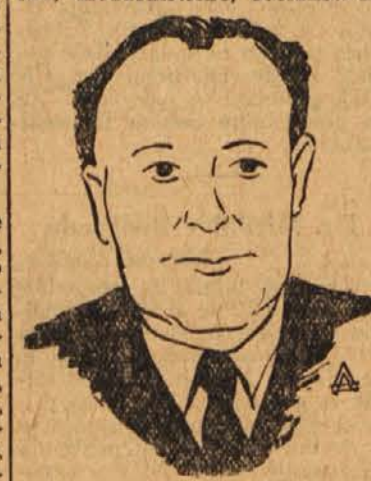
Podpredsednik Italijanske vlade Saragat

Rim, 2. marca (Tanjug). Parlamentarne skupine demokrščanske, monarhistične, socialistične