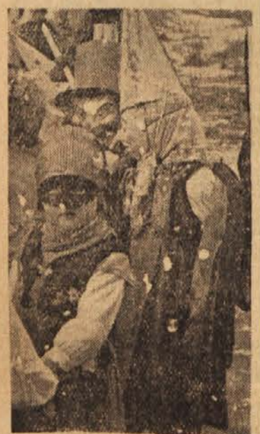
Ali nas poznate?

Skril se je med drevje in prihuje oprezoval. Nenadoma se osel dvignil glavo in mogočno zarigal. Bil je to strašen glas in tiger se je na smrt prestrašil. Zbežal je v goščo in zopet ugibal: »Kdo ve, ali bi me ta zver lahko pozrla?« Dolgo je čepel v grmovju ter se tresel od strahu.