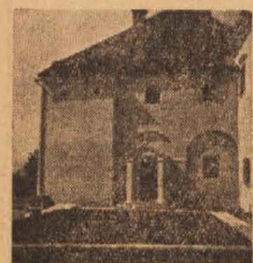
Vhod v ptujski Mestni muzej

Okrajno javno tožilstvo v Ljubljani je prejelo ovadbo zoper železniškega sprevodnika J. S. iz Notranjih Goric. Ta sprevodnik je 5. februarja letos ukradel v brzem vlaku med Divačo in Sezano neki potnici, ki je potovala v Argentino, okrog 120.000 din vreden paket, v času, ko je potnica šla v jedilni voz. Tat je paket skril v stranišču, ki ga je zaklenil. Potnica je še pravčasno opazila tatvino ter opozorila nanjo mlilničnika, ki je našel paket v stranišču, ter v bližini opozoval, kdo bo prišel ponj. Na sezanski postaji je sprevodnik skušal odnesti paket iz vlaka, tedaj pa ga je prijel mlilničnik in ga peljal k šefu postaje, ki je sprevodnika takoj izključil iz službe, potnica pa je dobila ukradeno blago nazaj.