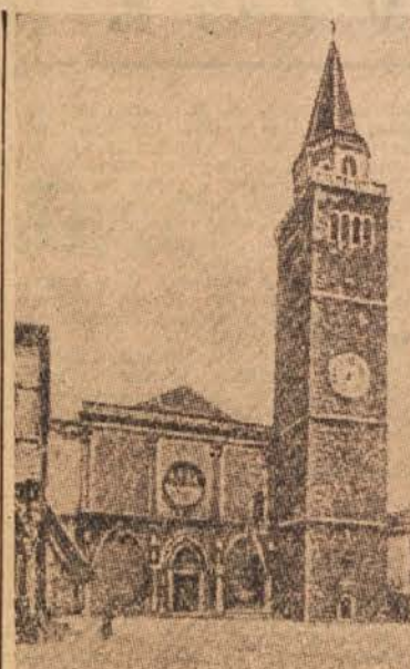
Koper hrani veliko zgodovinskih zanimivosti. Mestece je z raznimi starinskimi poslopji pravi muzej. Na sliki stara katedrala.

Zgraditi bi bilo namreč treba poslopje za osnovno šolo v Rogoznici, ki bi prevzela otroke iz Rogoznice, Podvinec, Zobjeka in Kicarja ter s tem znatno razbremenila osnovno šolo v Ptuj. Za osnovno šolo bi bilo nujno treba pridobiti šest učilnic v nekdanji okoliški osnovni šoli, ki jo ima sedaj JLA in pa sedanjo Vajeniško šolo, ki bi se preselila v poslopje sedanje gimnazije. Ta bi zasedla sedanjo Mladiko ter z zidavo kabinetov dobila primerne prostore, ki bi ustrezali sodnemu in za nekaj časa tudi bodočemu razvoju naše gimnazije. -7-