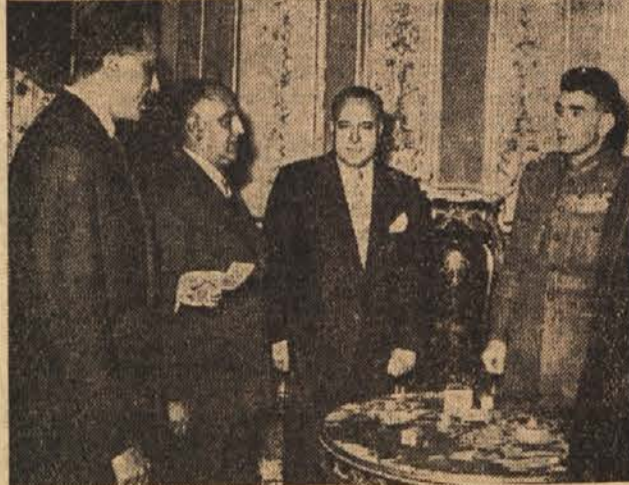
Predsednik Nagib v razgovoru z egiptovskimi predstavniki v nekaterih evropskih državah