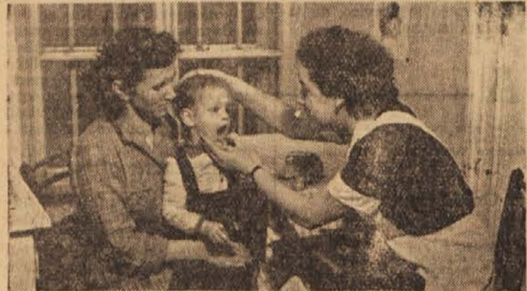
Medicinska sestra lahko ogromno pomaga pri zdravstveni prosveti ljudstva. Za tak poklic pa je treba seveda dosti razumevanja ljudi, njihovih težav in okolja, v katerem žive

Zelo dvomljivo je, če je bila edina ovira, da se dekleta niso številneje zanimale za to poklicno prav to, da se je zahtevala popolna srednješolska izobrazba. Vendar je Svet za ljudsko zdravstvo v Sloveniji menil tako ter skušal letos ponovno uvesti prejšnji način šolanja. Anketa, ki jo je razpisalo Društvo medicinskih sester iz Slovenije, pa kaže ta problem v drugačni luči. Odgovori medicinskih sester, ki že delajo v poklicu, se stoddostno strinjajo z mislijo, da je treba v ta poklic stopiti, ko je deklet vsaj kolikor toliko zrelo ter ima primerno splošno izobrazbo. Podobni pa so si tudi odgovori v teh anketah na vprašanje, kaj naj bi po njihovem zavrlo številneje prijavljane v šole za medicinske sestre. Prav te, ki so se že izkazale v svojem poklicu, navajajo, da so pogoji za njihovo delo še vedno zelo težki, zlasti izven bolnišnic po okrajih.