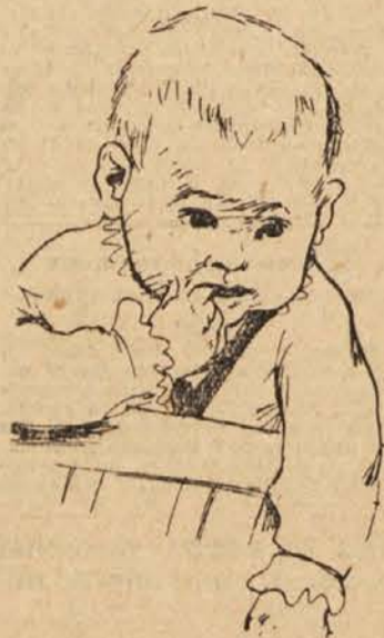
Kako je sladek

In, glejte, kaj je po dolgem razmišljanju Mitja napisal. (Zaradi spoštovanja do učenca in, priznajmo, tudi zaradi nekaterih osebnih čustev, zaradi simpatije, smo izpustili nekatere neprijetne packe, postavili bomo tu in tam