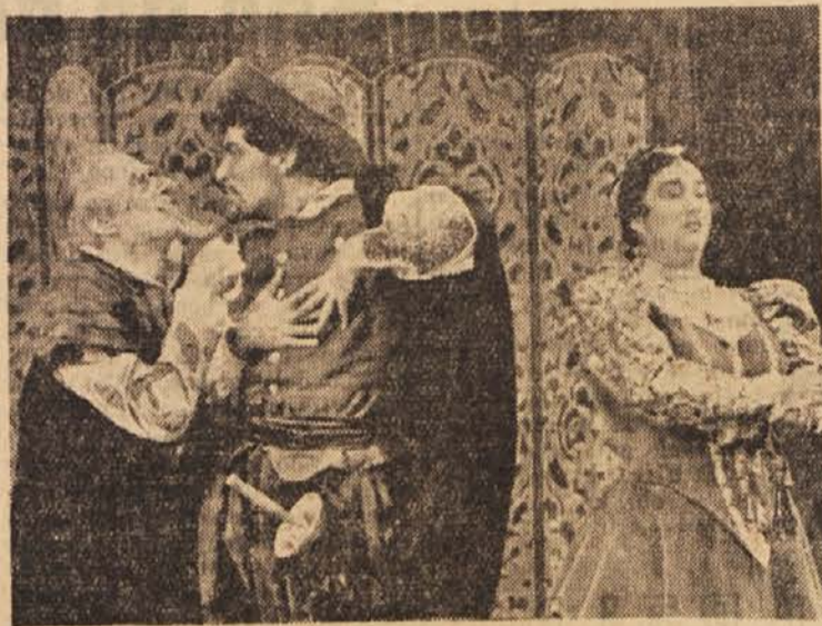
Sinoči je bila v ljubljanski Drami prvokrat uprizorjena komedija španskega dramatika Tirso de Moline »Don Gil v zelenih hlačah«...