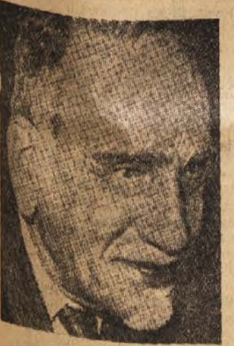
Hašem el Atasi

Damask, 2. marca (R). Predsednik stranke republike Hašem el Atasi je danes izjavil, da bo ponovno dobila veljavo ustava, ki jo je leta 1950 izdala ustavodajna skupščina. Poseben odlok predsednika Atajije govori o pripravah na splošne volitve in ljudsko glasovanje. Po rezultatih le-teh naj bi bil bodi parlament pooblaščen izdelati osnutek nove ustave. Volitve bi bile bržkone v roku 3 mesecev. Vsi predpisi in upravni odloki, ki jih je izdal Sišakijev režim, so razveljavljeni.