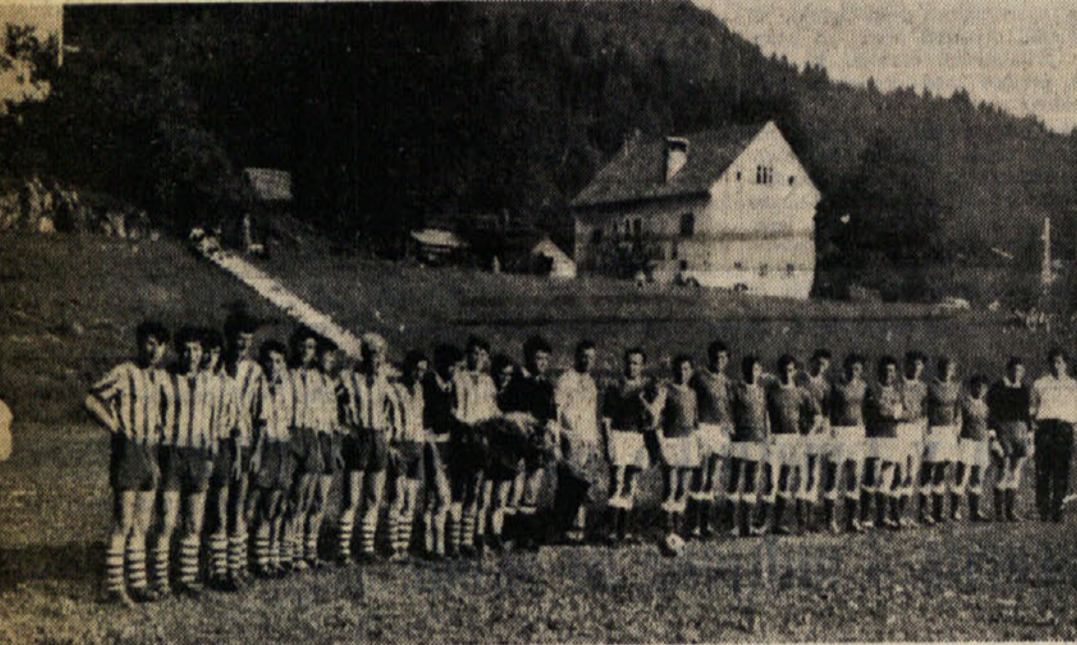
Moštvi Idrije in Brega pred tekmo

V nedeljo 18. t.m. je športno društvo BREG, z namenom, da počasti 20-letnico osvoboditve, organiziral množični izlet v Idrijo in bolnišnico Franjo, združen z nogometno tekmo z idrijskim Rudarjem.