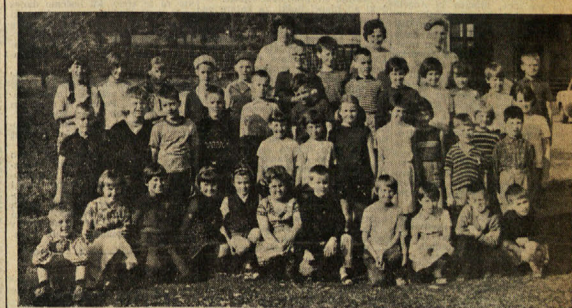
Naši otroci letujejo tudi v Žirovnic. O njih in njihovih počitnicah bomo pisali jutri. Za danes samo slika in seveda le pozdrav vsem mamam in očetom