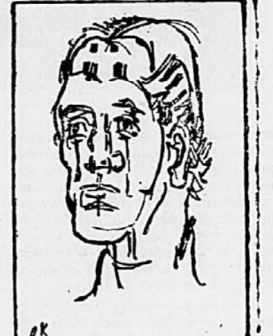
O. Kokoschka: Avtoportret, risba

Upravno in laboratorijsko vodstvo ljubljanske galerije je pripravilo nadse zahtimivo in poučno razstavo rentgenskih in infrardečih posnetkov dragocenih del nemškega slikarja Rembrandta iz svoje zbirke. Razstava, ki je prva znanstveno zasnovana kolekcija na tem področju spoznavanja in ocenjevanja umetnin, je bila na svoji svetovni turneji pred kratkim odprta v umetnostnem domu v Zürichu v Švici.