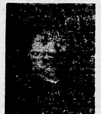
Rembrandt: Mali avtoportret

Slaven nisem, sem pa sumljiv — je nekdo rekel sam o sebi avstrijski ekspresionistični slikar Oskar Kokoschka. Naj bo to res ali ne — očitoma za mnoge obseje — dejstvo je, da je bil te dni ta uporniški, življenjski umetnik 70 let. Bilo je namreč 1. marca 1885, ko se je rodil v vasi Pečeč ali ne — očitoma za mnoge obseje — dejstvo je, da je bil te dni ta uporniški, življenjski umetnik 70 let. Bilo je namreč 1. marca 1885, ko se je rodil v vasi Pečeč ali ne — očitoma za mnoge obseje — dejstvo je, da je bil te dni ta uporniški, življenjski umetnik 70 let.