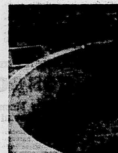
Detalji čistilne naprave v Sentvidu

Tudi z nadaljnjim napredkom tehnike kanalizacija na svojem