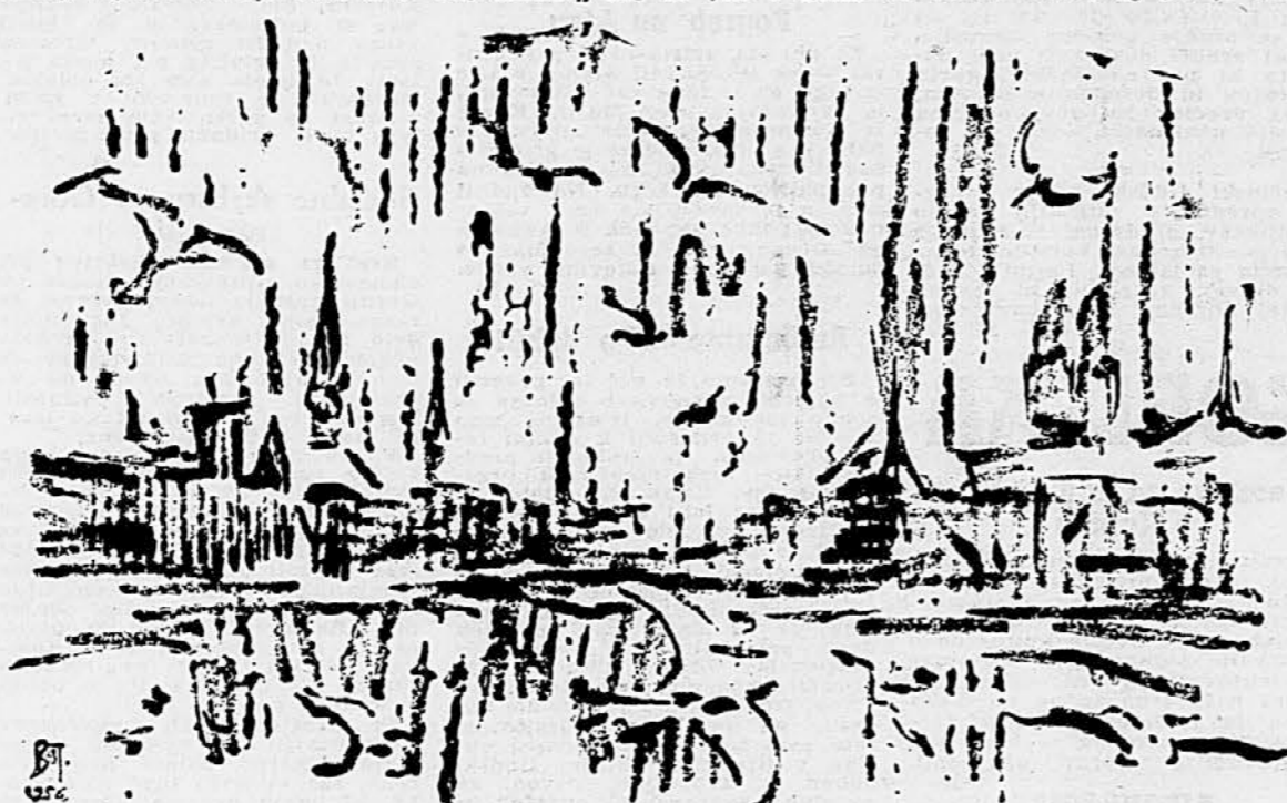
B. Jakac: Zürich (s pogledom na Heimhaus na desni strani), risba, 1956