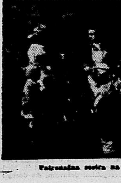
Vzgojiteljska sestra na obisku pri družini

močnejše ali laže bolnih. Pri anketiranih otrocih so sestre ugotovile, da je 95 rahitčnih, kar pomeni, da ima v Ljubljani vsak četrni otrok v starosti do 7 let rahitis. To veliko število rahitčnih otrok je opozorilo patronažne sestre, da poglobijo svoje profilaktično delo za pobijanje te bolezni. Tudi to delo so sestre uspešno opravljale. Redno so obiskovale vse rahitčne dojenčke in jih pošiljale na zdravljenje.