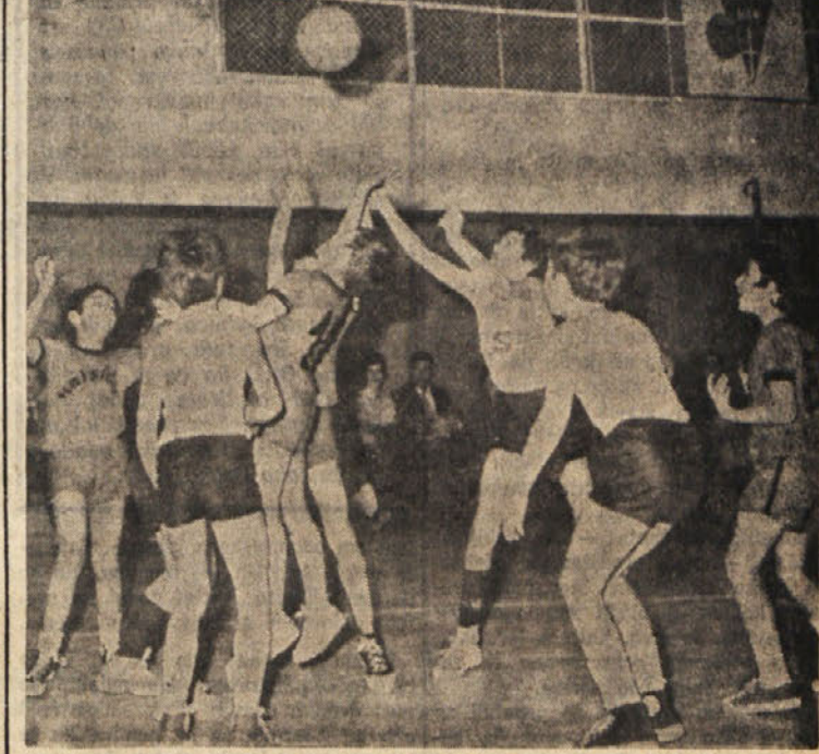
Ljubljana — Italsider: kdo bo prestregel žogo, ki je zgrešila koš?