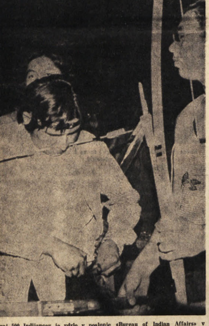
Skoraj 500 Indijance je vidno v poslopje «Bureau of Indian Affairs» v Washingtonu, da bi protestirali proti kritičnim pogodbam med obdelovalci in rdečimi vojščaki. Indijanci so se zabarikadirali v poslopje. Na sliki: rdeči vojščak s puščico v ustih