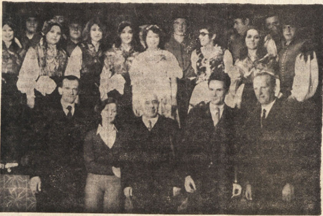
Petnajstdnevna bilanca kulturne dela delovanja v Sovodnjah...