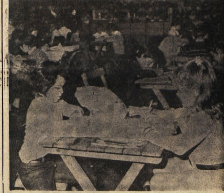
Razen v košarski spretnosti so se tekmovalci pomerili tudi v risanju