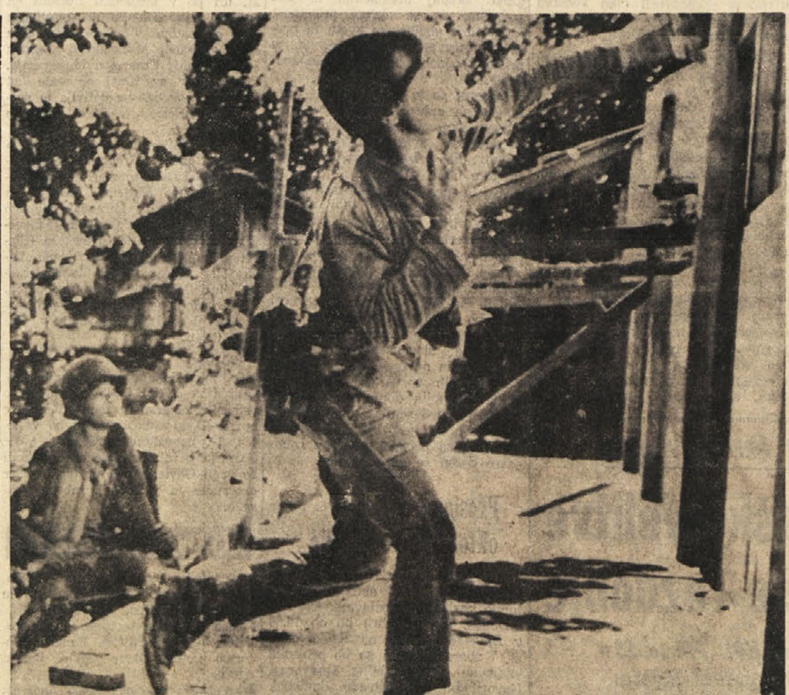
Saigonski vojak z rožnim vencem okrog vratu vrata meče ročno bombo v hišo, kjer naj bi se skrivali «komunisti». Slika je bila posneta v Tuong Hiep, nedaleč od Saigona. To mesto je bilo nekaj dni v rokah osvobodilnih sil, sedaj pa se saigonski režim «maščuje» nad civilnim prebivalstvom.