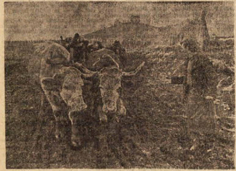
Stare kolje peljejo iz vinograda

Največ trajne škode je doslej ugotovljena v oljčnih nasadih na Koprskem. Pozebe je po obsegu podobna pozebi leta 1929, ko je propadlo 2/3 vseh nasadov. Navidežno je sicer zminzeleno listje popolnoma zgubilo svojo svežo barvo, eno — in dvoletne mladice so deloma ali pa popolnoma suhe, sem in tja pa so poškodovane osnovne veje in celo deblo razpokano od tal do krone. Stopnja pozebe je torej zelo različna in bi treba previdnosti pri obrezovanju. Za zdaj je odstraniti samo manjše suhe poganjke in močno razpokane veje, kasneje pa bo Kmetijska služba OZZ Koper dala vsakemu proizvajalcu konkretna navodila. Da bi si po mrzu poškodovanost sadno drevje hitreje opomogli, je treba nasade gnojiti s hitro topljivimi gnojili. Gnojila je dodati čim bližje koreninam. Radi tega je zelo uspešno gnojenje s tekočimi gnojili ali pa globoko podkopavanje gnojil. V sestavi gnojil je treba dati poseben poudar na kalij in fosfor, ki posebej ugodno vpliva na razvijanje ran, ki jih je povzročila zimska pozeba. Ing. F. A.