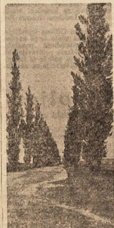
Topoli v Prekmurju

V Pomurju so se črni topoli že dokaj udomačili — posebno še tako imenovani jagnjedi ali piramidasti topoli, ki krasijo sli-