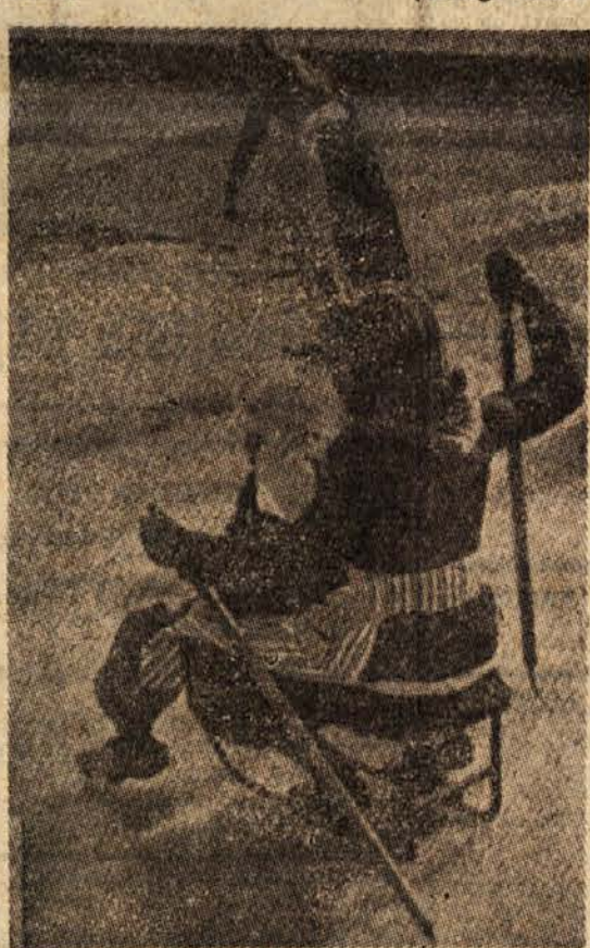
Pozimi na Nizozemskem zmrznejo številni kanali. Takrat po ledeni plošvi drsijo drsalski od vasi do vasi. Na sliki vidimo mamico, ki je vzela na sanhah v naročje svojega otroka in se z njim vozi po ledu. Pri tem pa si pomaga z dvema palčama, ki imata na koncu železne osti.

Ce pogreši v raketi, ki jo usmerjajo na daljavo, zamotana naprava samo za desetino odstotka, pomeni to na tri kilometre odklon za osem metrov od njene poti. V reaktivnem letalu, letelcem s hitrostjo zvoka ali pa še hitreje, gre razlika tako v kilometre.