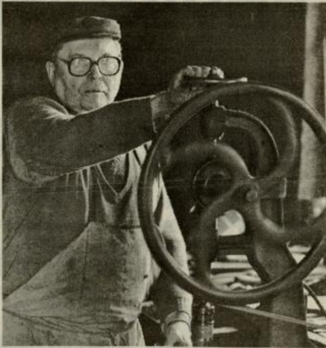
Ob ognjišču stare sladkogorske kovačnice.