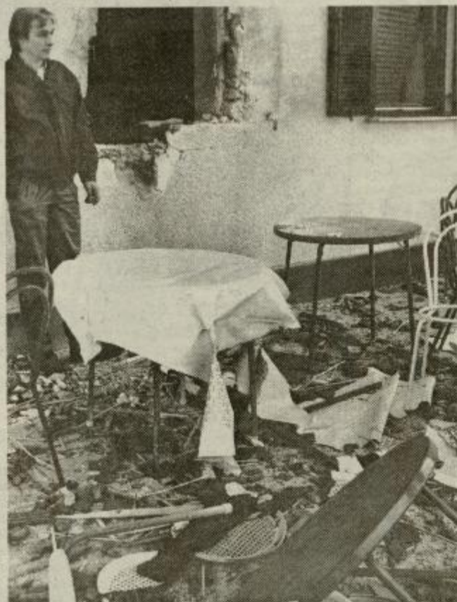
Oktober 1993, neposredno po razdejanju pizzerije Limbo.