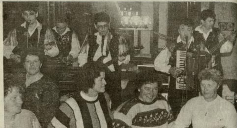
Štirje kovači med svojim nastopom na letošnjem izletu 100 kmečkih žensk na morje.