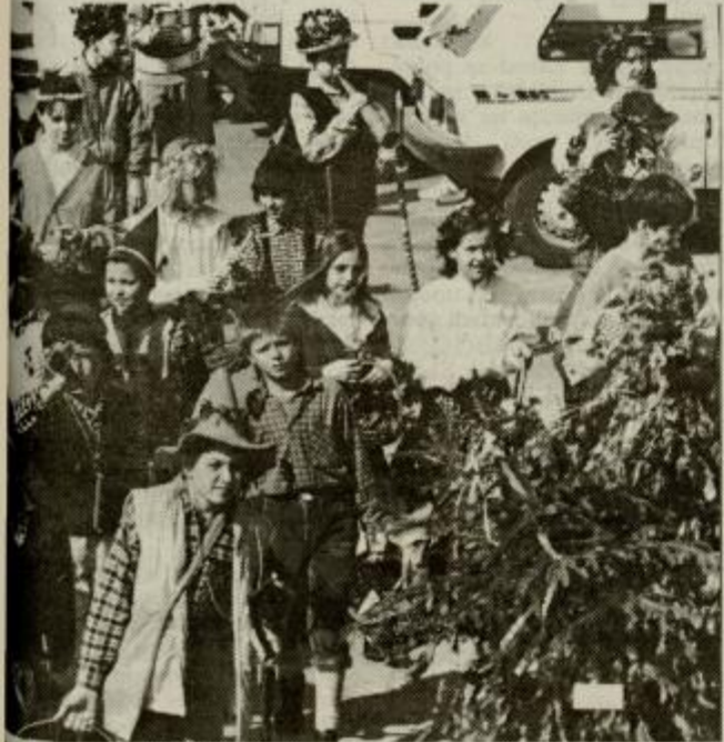
Laškem pomladanski praznik v pravem pomenu besede. Tudi zdaj že narediti sami, sprva so morali pomagati dedki.

»ponekod na Jurjevo okrasili cerkve s svežim zelenjem, in tudi, da je bil v Taboru v Savinjski dolini, kjer je Jurij patron, nek moč, ki je vsako leto na Jurjevo prinesel v cerkev zeleno bukovo vejo, če je narava ni dala, jo je pač silil v hiši pri topli peči.