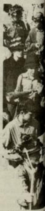
Že kar nekaj rogove, piščali

malce podobno vzhodu pa ta boginji Ves preobleka m legendi dodaj ki da jo je reja. Pod Peco genda Jurija jažem. Omet