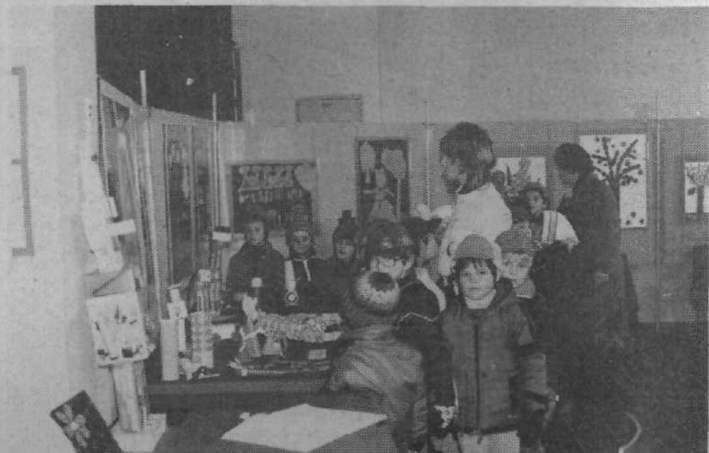
"Veliko stvari lahko čaka, vendar ne otrok. Otroku ne moremo reči - jutri". Njegov čas je danes. V letu otroka so pod tem geslom v domu družbenih organizacij Stadion pripravili izredno privlačno razstavo ročnih izdelkov in risb cicibanov iz bežigradskih vrtec. Za razstavo je veliko zanimanje, iz dneva v dan si jo prihajajo ogledovat mladi iz vrtec in bežigradskih šol, pa tudi številni občani, ki prihajajo na razne sestanke v družbeni dom.