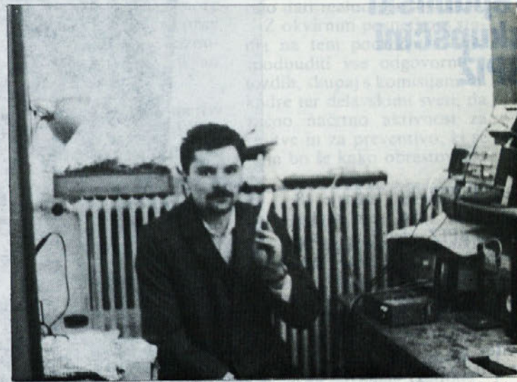
da smo dobro opremljeni in bi to morali zares izkoristiti za pridobi-