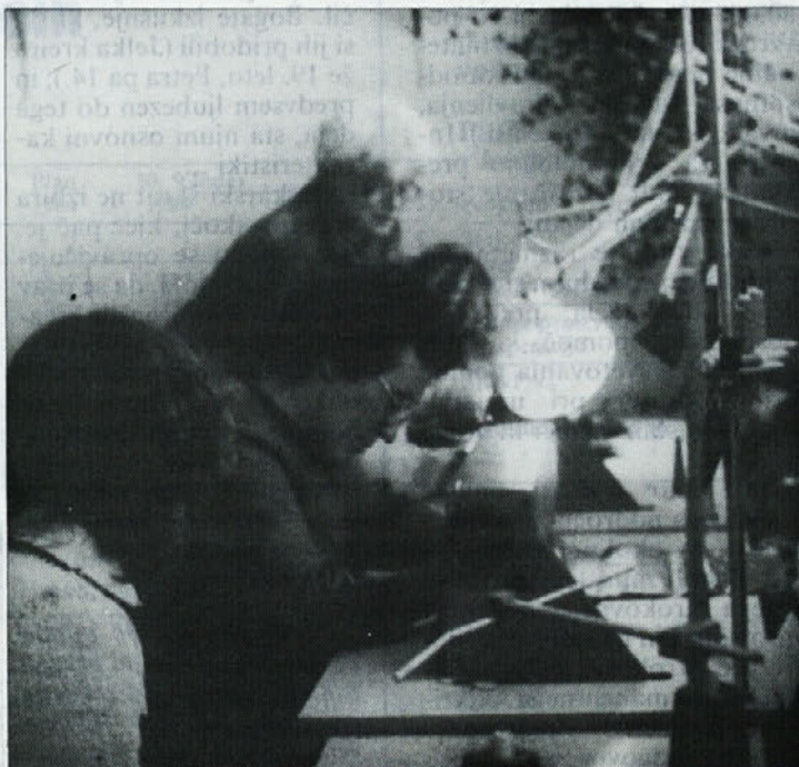
Inštruktaža v pripravi kril za šivilje iz IMV.