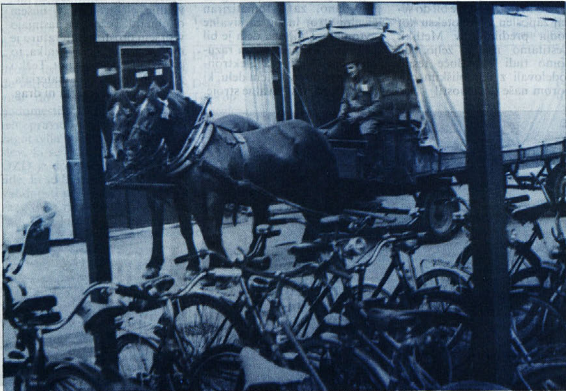
Značilnosti ptujskega področja: kolesa in konji, s katerimi trgovina pripelje v Delto pijačo in hrano.

Obravnavana je bila tudi problematika vštevanja časa opravljanja kmetijske dejavnosti zakonca kmeta-kooperanta v pokojninsko dobo s predlogom za spremembo in dopolnitev sklepa o pogojih, načinu, osnovi in rokih za plačilo prispevkov za vštevanje časa opravljanja kmetijske dejavnosti v pokojnin-