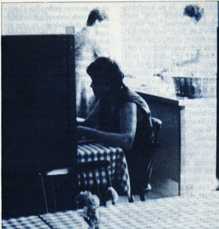
V jedilnici Zale je vedno prijetno.

LIBNA ima letno 3 do 4 primere, ki zahtevajo prerazporeditev. V večini primerov pridejo v poštev le dela in naloge zlagalke ali kontrola šivanja. Zavedajo se, da bo zahtevek za prerazporeditev z leti vse več, in zato se je treba te-