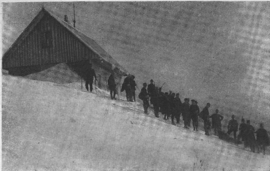
Po nesreči na Stolu 4. IV. 1912 spravljajo drenovci in alpinci dijake v dolino