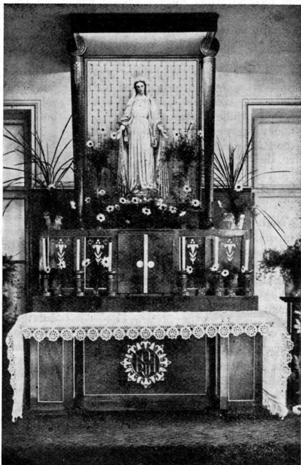
Oltar v domu Device Mogočne.

Dobro uro hoda iz mesta Kranja, leži prijazna vas Besnica. Kakor se povsod drugod, tako se je tudi pri nas osnoval dekliški krožek, ki nam nudi najpotrebnejšo izobrazbo. Ker nimamo prilike pogosto prirediti sestankov, zato se teh tembolj z večjo