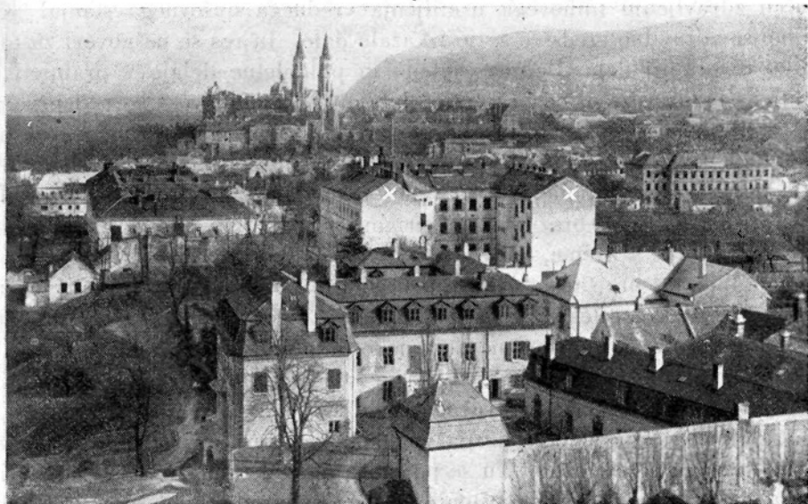
Klosterneuburg. S X zaznamovano poslopje je bolnica.

leti, je pozabljeno. Edina opora je bolni materi. — Pa se je morala radi nekega starega slučaja javiti pri stražnikih, hoteč obravnati s preteklostjo. No in ti so jo poslali v Klosterneuburg. Od sramote si mora reva vzeti življenje. Ubogi starši! Sprašujem, pomirjam. Pripovedovanje je gladko, brez vsakih presledkov. Pomilovanja vredno, ali ne? — Na ta ali oni način ti bomo pomagali iz nesreče! — Pa mi zašepče v uho njena »prijateljica«: »Prav danes sva bili skupno odvedeni iz istega hotela.«