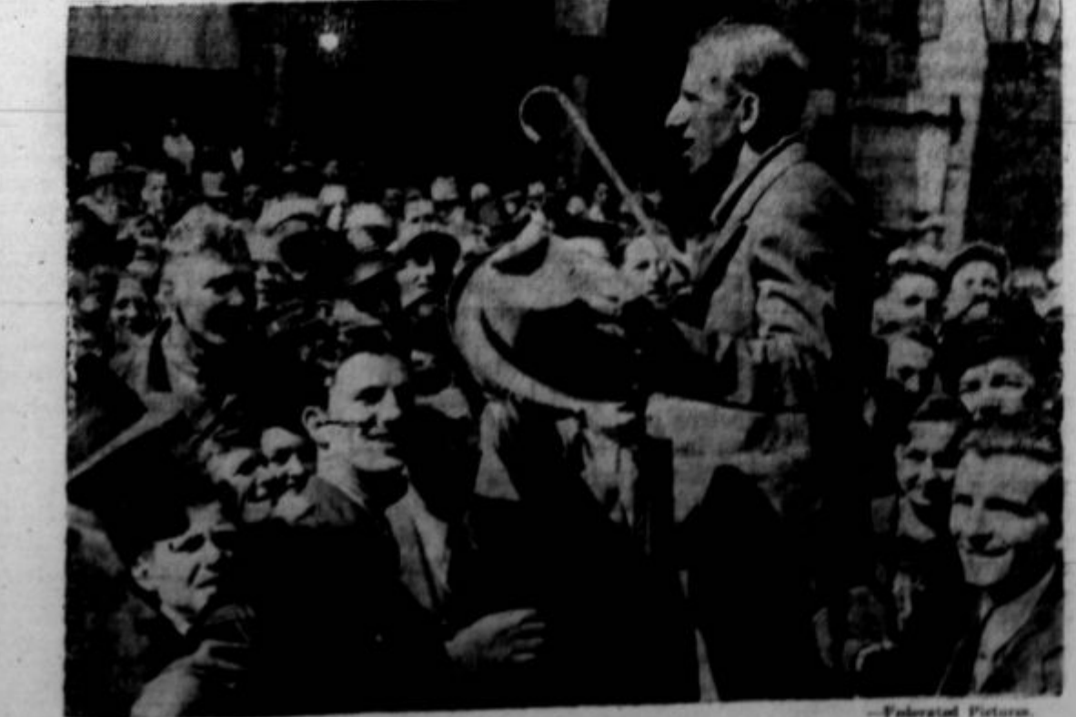
Čikaška razstava: Jimmy Durante, popularni filmski zvezdnik.

— Poslal sem nekemu uredništvu dve svoji pesmi . . . — Pa? — Vrnili so mi pa—tri!