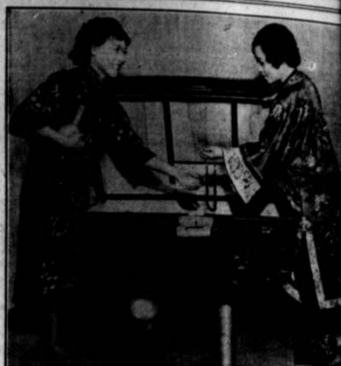
Čikaška razstava: Kitajska dragocenost na razstavi je verižica, katero je nosila pokojna kitajska cesarica-vdova.

Obtoženec: "Oženjen sem deset let in moja tašča stanuje pri meni."