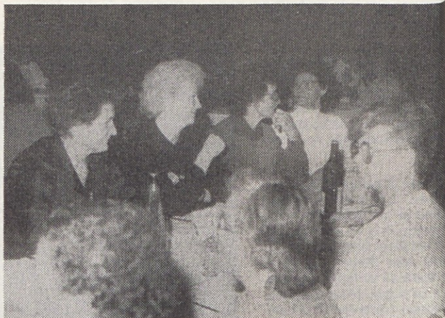
Novoletno srečanje delavcev Gorenja Gospodinjski aparati, ki so se upokojili v letu 1991