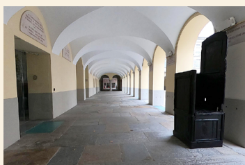
Hodnik pod arkadami z don Boskovo prižnico za lahko noč.