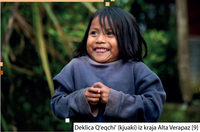
Deklica Q'eqchi' (kjuaki) iz kraja Alta Verapaz [9]