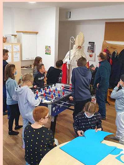
OBISK SV. MIKLAVŽA • Bolj kot materialne stvari potrebujemo čas, ki ga podarimo drug drugemu. K temu je spodbudil tudi sv. Miklavž, ki je obiskal otroke in sodelavce programa Skala. Kot vsa leta doslej je tudi lanskega decembra obiskal in predvsem »pridne« otroke tudi obdaril: nekatere v dnevnem centru, druge v Klubu, tretje v Šoli cirkusa, pozabil pa ni tudi na tiste, ki se zbirajo na Minibusu veselja.