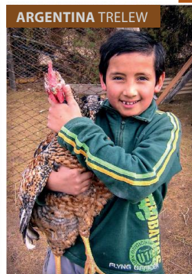
Deček s petelinom iz okolice svetišča Nuestra Señora de la Paz [6]