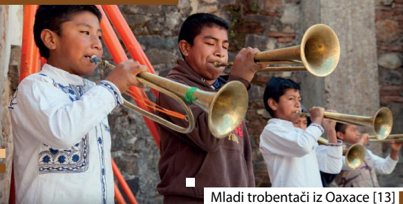
Mladi trobentači iz Oaxace [13]