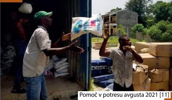
Pomoč v potresu avgusta 2021 [11]