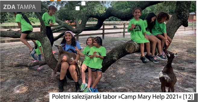
Poletni salezijanski tabor »Camp Mary Help 2021« [12]