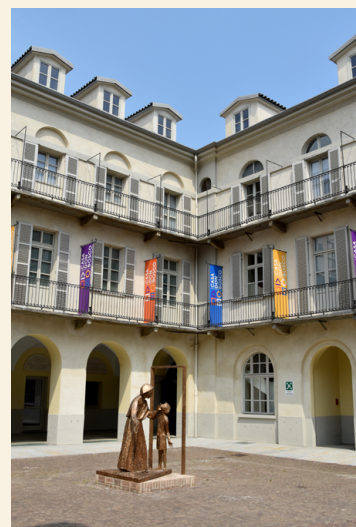
Kip mame Marjete stoji na mestu, kjer je don Boskova mati na nekaj kvadratnih metrih gojila zelenjavo.