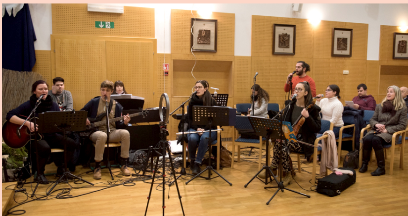
3D VEČERI • V Don Boskovem centru v Celju so začeli s t. i. 3D večeri. Trije D-ji pomenijo duhovni večeri, debate in predavanja ter družabni večeri, s katerimi želijo odgovoriti na potrebe mladih kristjanov, ki iščejo priložnosti za srečanja in notranjo obogatitev. V soboto, 18. decembra 2021, je potekal prvi slavlilni večer s skupino »Veselje« iz Radenec.