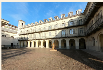
Današnje dvorišče na mestu prvega dvorišča pred Pinardijsvo hišo.