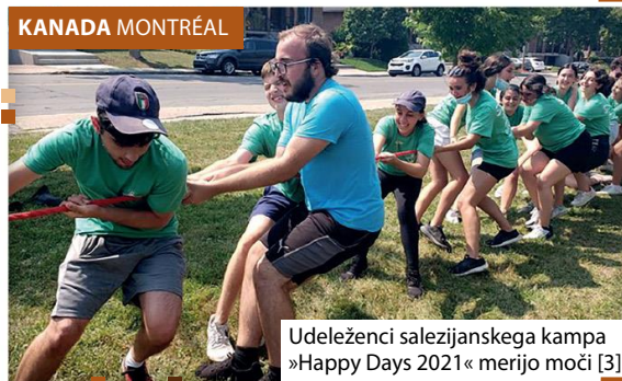
Udeleženci salezijanskega tabora »Happy Days 2021« merijo moči [3]