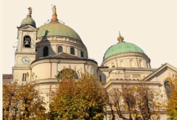
Bazilika Marije Pomočnice v Turinu, ki jo je zgradil don Bosko.