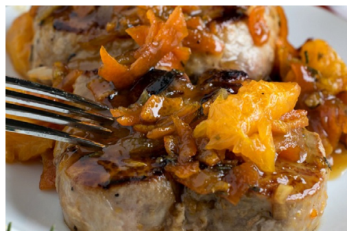
FOTOGRAFIJA JE SIMBOLIČNA

Jušno osnovo zmešamo s timijanom in marmelado. Meso iz ponve položimo na topel krožnik, kjer naj kratek čas počiva. Iz ponve odlijemo olje, nato vanjo vlijemo marmeladno mešanico in jo povremo, da nastane omaka. Po želji jo zgostimo. V ponev vrnemo meso, ga prelijemo z omako in pustimo nekaj časa, da se naužije omake. Postrežemo s pečenimi bučkami.