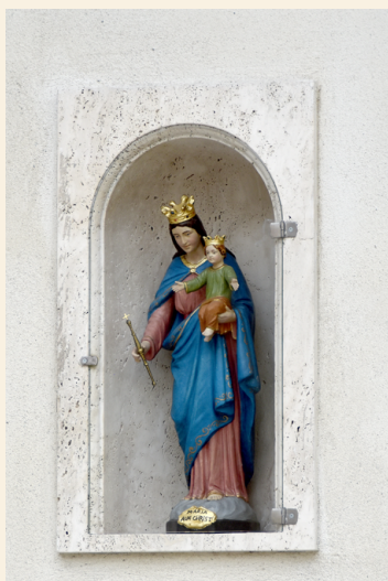
Niša s kipom Marije Pomočnice na fasadi don Boskovih sobic.

so se lahko v kratkem sprehodu umirili pred učenjem, pred molitvijo v cerkvi in pred spanjem.