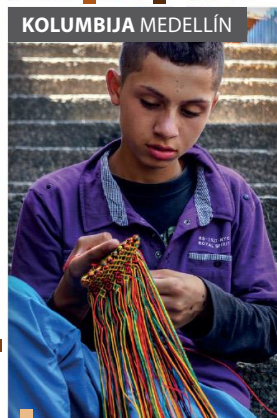
Mladi pletilec iz salezijanskega zavoda Ciudad Don Bosco [5]