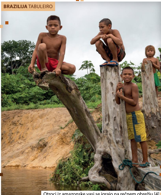
Otroci iz amazonske vasi se igrajo na rečnem obrežju [4]