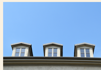
Frčade dajejo svetlobo podstrešnim prostorom, danes namenjenim mladim.

Zraven na dvorišču je bila prva obednica: »Ob lepem vremenu so se razgubili po vsem dvorišču sem in tja. Razdelili so se v skupine po štirje, nekateri so ostali tudi sami, eden je sedel na kak tram, drugi na kamen ali drevesni štor, pa spet na kako klop ali tudi na golo zemljo. Tako so použili tisto, kar jim je Božja previdnost po don Boskovem prizadevanju pripravila za hrano. Ob slabem vremenu so ostajali v kuhinji, posedli na tla v sobi, nekateri na stonpice ali pa v spalnici. In pijača? Prav tam zraven je bil vodnjak s svežo, hladno vodo. Ta vodnjak je bil za fante sodček in klet obenem. Pa še zastoj je bila.« (MB III, 350)