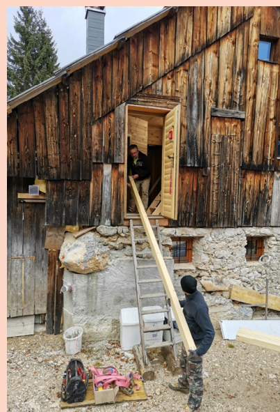
KOČA NA USKOVNICI • V lanskem letu so farani in skvati iz Cerknice ter drugi prostovoljci na Uskovnici opravili 37 delovnih dni oziroma 1800 ur prostovoljnega dela. Dela je opravljalo 53 različnih prostovoljcev. Uredili so kuhinjo, jedilnico in spalnice v koči ter sanirali in začeli s prenovo pomožnega objekta s kapelo.