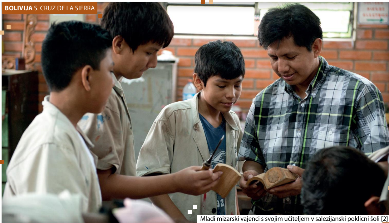
Mladi mizarški vajenci s svojim učiteljem v salezijanski poklicni šoli [2]