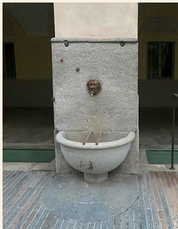
Vodnjak, ki še danes teši žejo mladim in romarjem, je pravi stražar Oratorija.