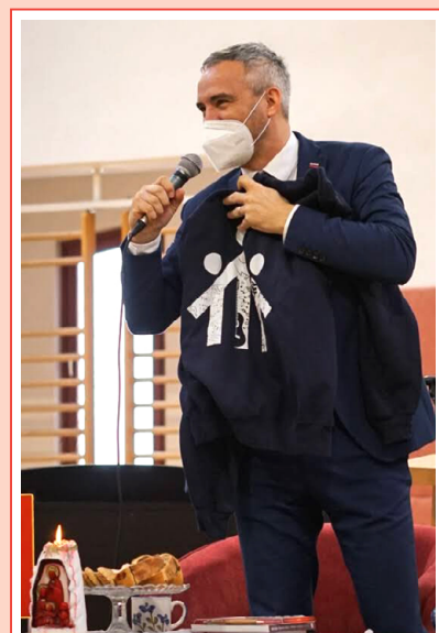
MINISTER NA OBISKU • Na Gimnaziji Želimlje vsako leto pred novoletnimi prazniki pripravijo božično-domovinsko prireditev. Na lanski, 23. decembra 2021, jih je z obiskom počastil Janez Cigler Kralj, minister za delo, družino, socialne zadeve in enake možnosti.