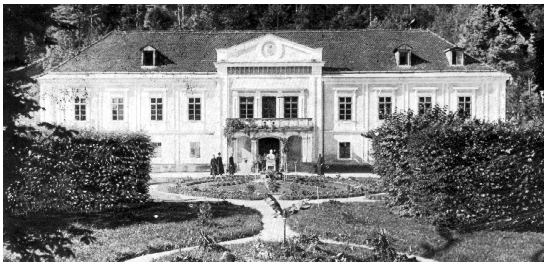
SALEZIJSKI ZAVOD NA RADNI

menom in darovale Bogu svoje delo, bomo zadovoljile tudi naše bližnje, saj nikoli ne naredimo stvari tako dobro kot prav takrat, ko jih naredimo za Boga.«