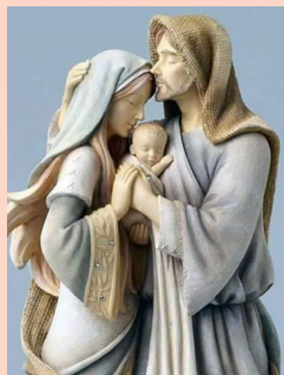
RADOST LJUBEZNI • Hčere Marije Pomočnice (FMA) smo se v letu 2021/22 odločile za posredovanje vsebin papeževe apostolske spodbude Radost ljubezni v katezezi, v družinah in med mladimi. S tem se želimo dejavno vključiti v leto družine ( Amoris laetitia ). Največ poudarka je na vsebinah 4. poglavja in na načinu pogovarjanja v družini oziroma v skupnosti.