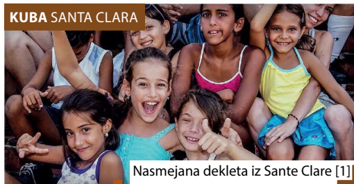
Nasmejana dekleta iz Sante Clare [1]