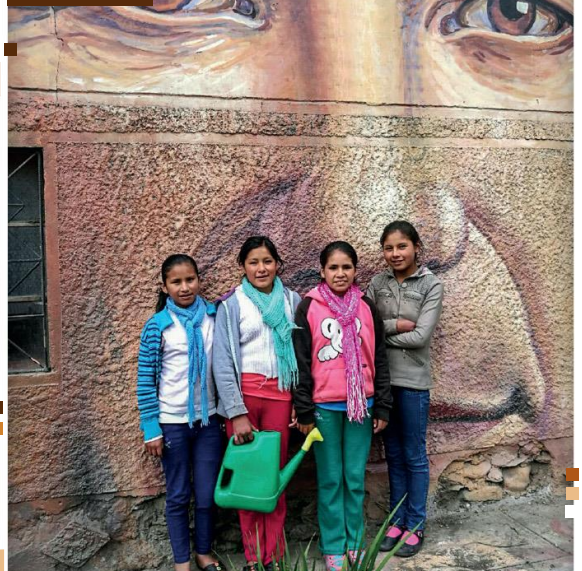
Deklice v sprejemnem domu Don Bosco »Monte Salvado« [10]