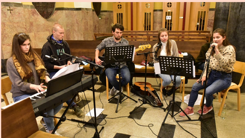
SLAVILNO MOLITVENI VEČER • 22. oktobra 2021 je v cerkvi sv. Terezije Deteta Jezusa na Kodeljevem ponovno zadonela mladinska slavlina glasba. Pripravili so slavnino molitveni večer za mlade iz dekanije Ljubljana - Moste.