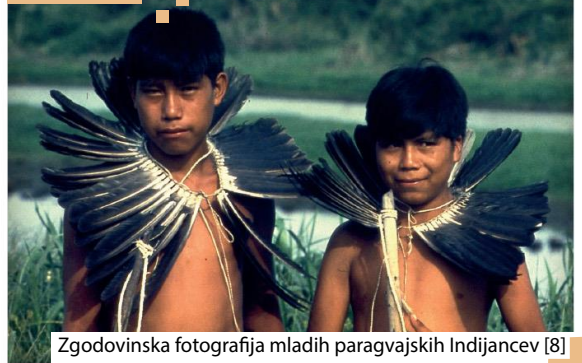
Zgodovinska fotografija mladih paragvajskih Indijancev [8]