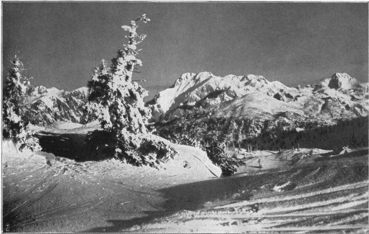
Velika Planina v snegu — pogled na Planjavo in Ojstrico