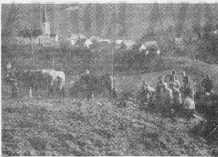
Tam, kjer je bila zemlja orna, so si Zagorjani pomagali s plugom in volmi. Na sliki so pri delu na glavnem vodu. Med njimi je tudi 76-letni Postišek, ki je skupno z ostalimi krepko vihtel lopato.