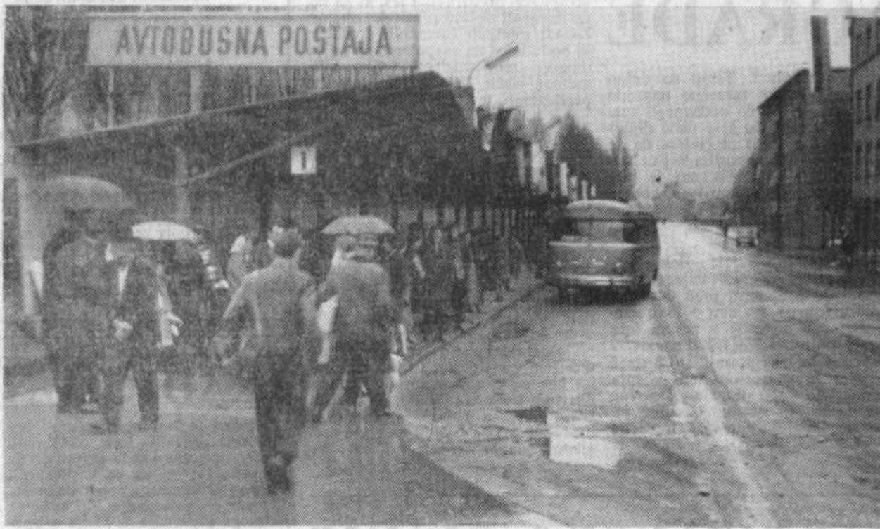
CELJSKA AVTOBUSNA POSTAJA JE POSTALA OZKO GRLO AVTOBUSNEGA PROMETA. LE REDKOKDAM LAHKO AVTOBUSI STOJE PRI DOLOČENIH JIM STEVILKAM, PRAV TAKO PA BI VSAKRSNO OZNAČEVANJE LINIJ POD STEVILKAMI NE KORISTILO. VSEKAKOR BO TREBA ČIMPREJE UREDITI DALJSI POSTAJALNI PROSTOR, OBENEM PA BO TREBA RAZMISLITI O PARKIRNEM PROSTORU ZA AVTOBUSE, KAJTI V SEDANJEM POLOŽAJU MORAJO PARKIRATI V DVA KILOMETRA ODDALJENIH GARAZAH.