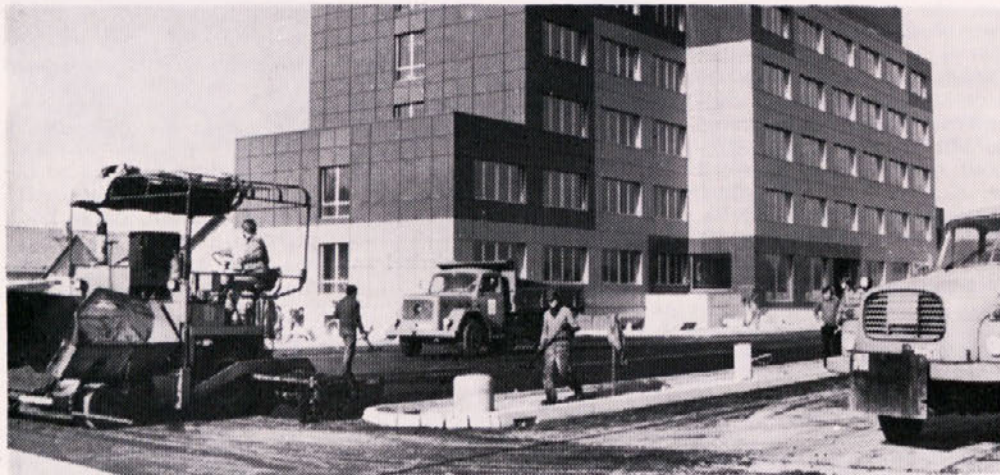
V decembru smo opravljali še razna zaključna dela pri poslovni stavbi — na sliki asfaltiranje dvorišča. V prihodnjem glasilu pa bomo našo stavbo predstavili v barvah.