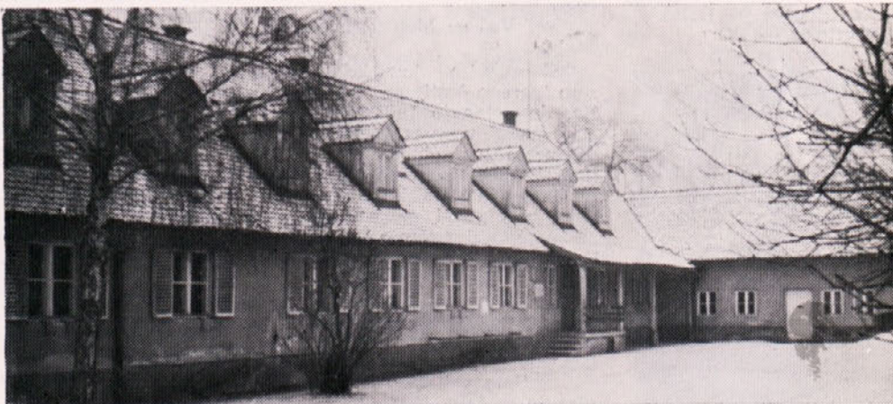
Ponedeljek, 14. 12. 1981. Nizka stavba na Ljubljanski cesti 16 že prazno sameva. Polnih 23 let je bila sedež skupnih služb naše DO. Zdaj jo bomo z veseljem pozabili.