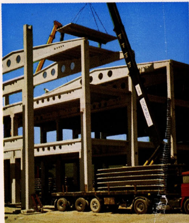
Letos smo zgradili prvi trietažni objekt po montažnem sistemu Ingrad, to je hala Libela v Celju. Pomemben napredek v razvoju našega gradbeništva.

Preselitev v besedi in sliki, na 8. strani.