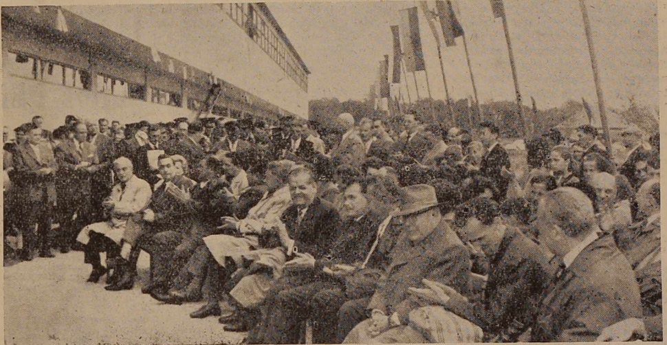
Med otvoritvijo novega obrata v Boračevi