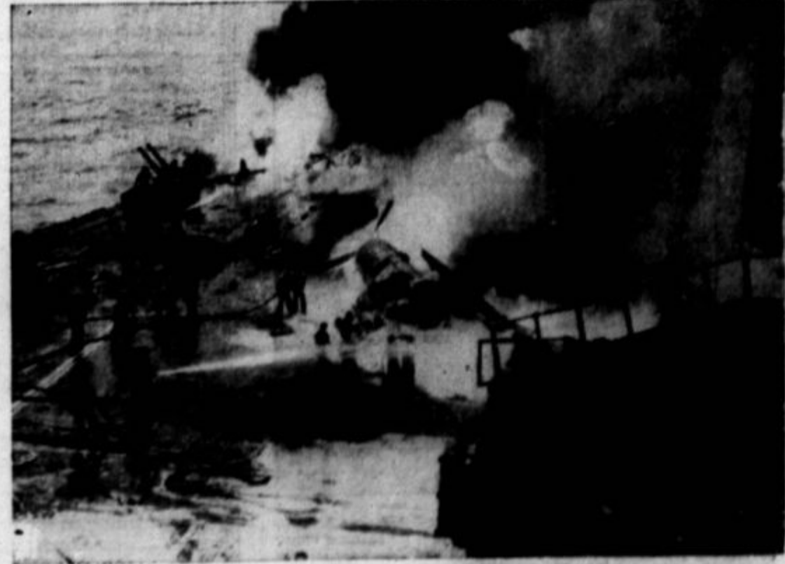
Mornarji gasijo ogenj na ameriški bojni ladji Saratoga, ki je bila zadeta od bombe iz zraka pri otoku Iwo.