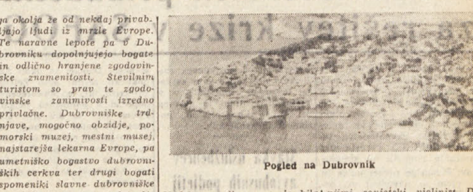
Pogled na Dubrovnik

Prvega julija so se v Dubrovniku začele že tradicionalne dubrovniške letne igre, ki so po vrsti že devete. V Evropi je veliko festivalov, ki vsako leto privabljajo tuje in domače goste od vsega tuda. Festival v Firenci, Salzburgu, Bayreuthu, Helsinkih, v Aixu en Provençi, Berlinu, Benetkah so med najbolj znanimi festivali v Evropi. In vendar so se med vsa to množino festivalnih prireditelj dubrovniške letne igre uspešno uveljavile. Toda ne samo uveljavile. Lahko že zatrjujejo da postaja Dubrovniški festival iz leta v leto ena najbolj zanimivih festivalskih prireditev Evrope.