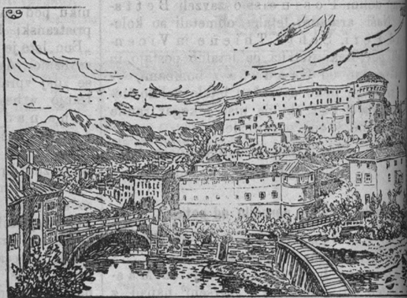
Ansicht von Rovereto mit Schloß.

Pred okroglo enim letom pričeli so Italijani svojo izdajalsko vojno proti Avstriji. Na eni strani so mislili, da bodejo kar čez noč prodrli Sočino fronto in zavzeli Gorico ter Trst. Ali zmotili so se grozovito in še danes — po preteku enega leta in peterih bitkah ni stopila noga italijanskega vojaka v Gorico. Na drugi strani zopet so Italijani nameravali suniti proti južno tirolski prestolici Trientu. Na tej poti bi morali v prvi vrsti zavzeti mesto Rovreit (Rovereto). V italijanskih in sploh v nam sovražnih listih se je že tako pisarilo, kakor da bi stal Rovreit neposredno pred padcem. Zdaj pa se je stvar temeljito spremenila. Avstro-ogrsko ofenziva pričela je ravno iz Rovreita in okoli tega mesta ležečih visočin. Mesto Rovreit, katerega sliko danes prinašamo in v katerem je najzanimivejši stari grad, leži ob izlivu potoka