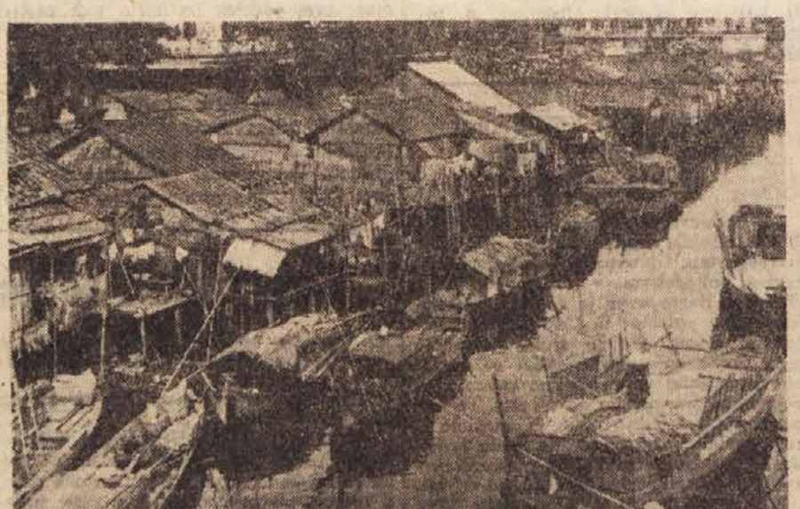
V Vietnamu, kjer že dolgo divjajo boji med francoskimi in Hošiminhovimi četami, je doma tudi veliko siromaštvo. Na sliki so čolni, v kakršnih životari na tisoče Vietnamcev

Bruselj, 23. marca. (AFP) V Belgiji se je sprožil val stavk zaradi nagle po- dražitve živil. Devet sto delavcev v Tur- houtru in delavci kovinskih podjetij v Liegeu so že začeli stavkati. Delavci v Liegeu stavkajo zaradi podaljšanja voja- škega roka. Vlada se je danes začela po- gajati z zastopniki sindikatov o zvišanju mezd. Kljub temu pa sodijo, da bodo sindikati, ki jih vodijo socialisti, začeli široko akcijo za boj zoper dražjino, ne glede na ta pogajanja.