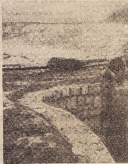
Pod strugo reke bo tekla potok Grandola. Z njegovo vodo bodo namakali polja na desnem bregu reke

Z vodo Grandole bodo namakali le del, kajti dolina premore tisoč dve sto hektarov plodne zemlje. Zato bodo niže, bliže izliva reke v morje, zgradili drugi »sifon«. Delati so že začeli in tudi tu bodo strokovnjaki izkoristili posebnosti te doline. Na levem bregu je bilo še nedavno veliko močvirje. Voda, ki je pri-