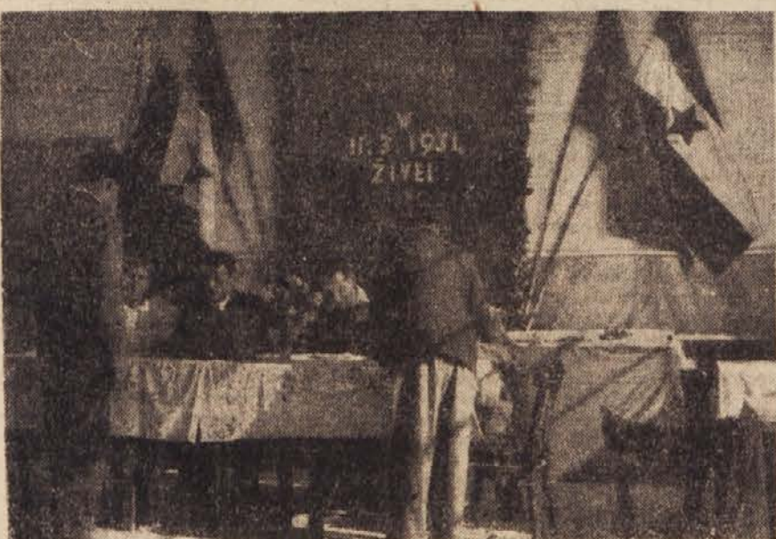
Tudi delovni kolektivi v istrskem okrožju so si izvolili delavske svete. Slika nam kaže volišče delavskega sveta rudarjev v Sečovljah

Washington, 23. marca (UP). Obvesčeni krogi so v petek izjavili, da se »mного preudarja« o tem, da bi predsednik Truman podal v imenu vseh zaveznikov ZN važno izjavo glede nove politike v zvezi s korejsko vojno. Izjavljajo, da je 13 narodov, ki se borijo z ameriškimi silami, menilo, da je treba sedaj, ko so se čete generala Mac Arthurja priborile do 38. vzporednika, podati splošno sliko o ciljih ZN. Argument za novo izjavo sloni delno na upanju, da je morda kitajski režim prišel do prepričanja, da je sedaj ob 38. vzporedniku treba prekiniti sovražnost. Zavezniki hočejo, da bi znova povedali, da se hočejo sile ZN izogniti nadaljnemu prelivanju krvi. Ta spravišnja izjava naj se kombinira z novim svarilom, da so ZN kljub temu odločeni nadaljevati z vojno, če bi Kitajci ne hoteli prekiniti sovražnosti.