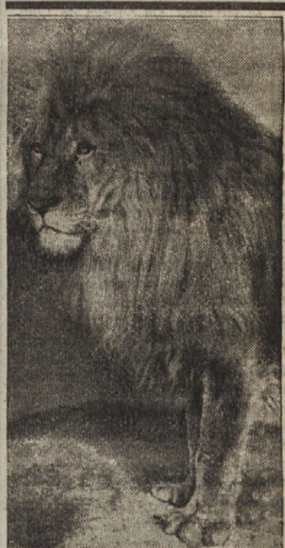
Naj mogočnejši zaveznik cenzure.

ki je socialistični strokovnjak za finančna in gospodarska vprašanja.