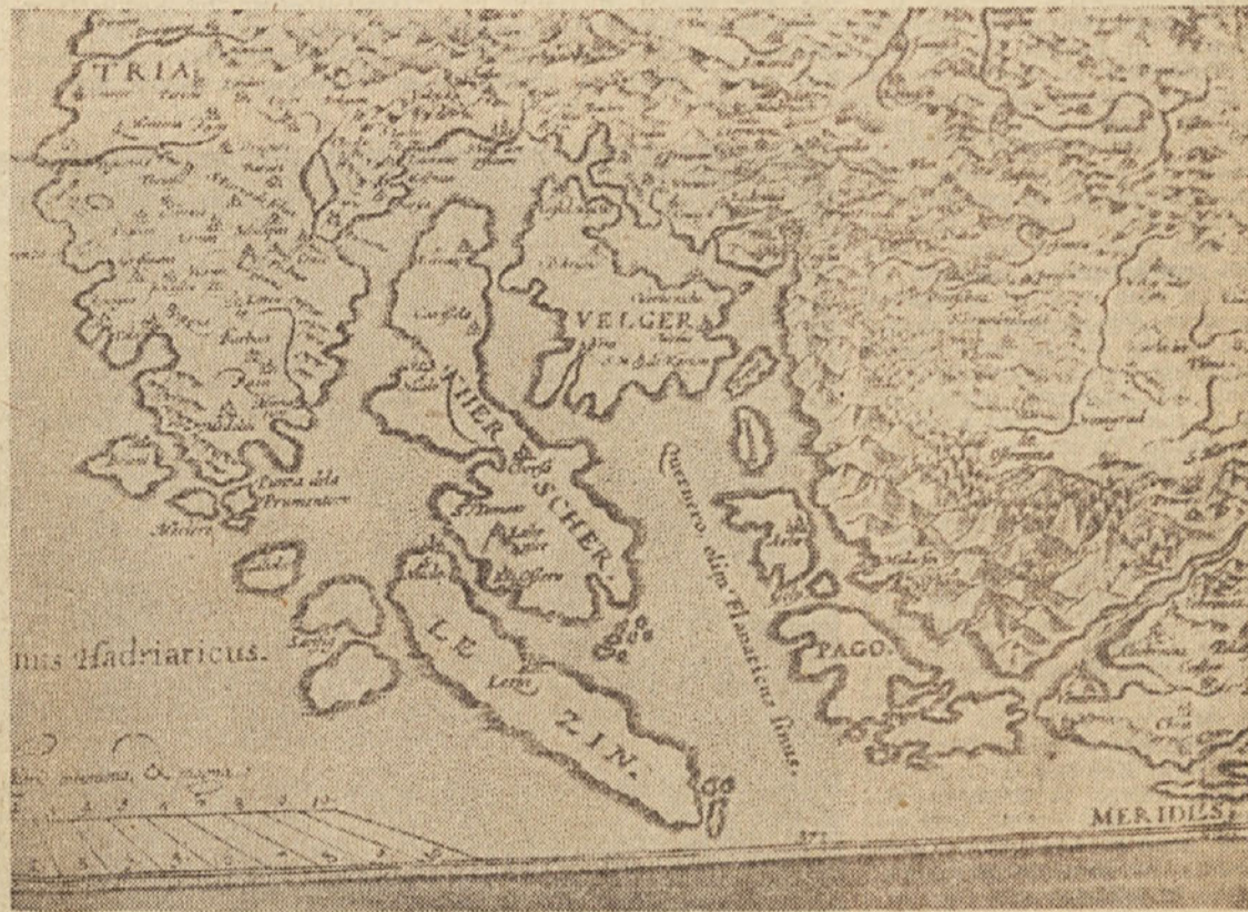
Ilirik (Illyricum) — karta slovenskega in hrvskega ozemlja, objavljena v Ortelinovem atlasu »Theatrum Orbis Terrarum«, ki je izšel v Antwerpnu (1573). (Hrani jo zemljepisni muzej v Ljubljani)

Zemljepisni muzej je v zadnjih letih priredil vrsto uspešnih razstav doma in v nekaterih krajih Slovenije. Poleg historično geografskega gradiva je na teh razstavah prikazal geografski razvoj pokrajine od 19. stol. dalje za nekatera področja Slovenije, nekatere elemente družbeno-geografskega razvoja pa tudi za področje celotne Slovenije.