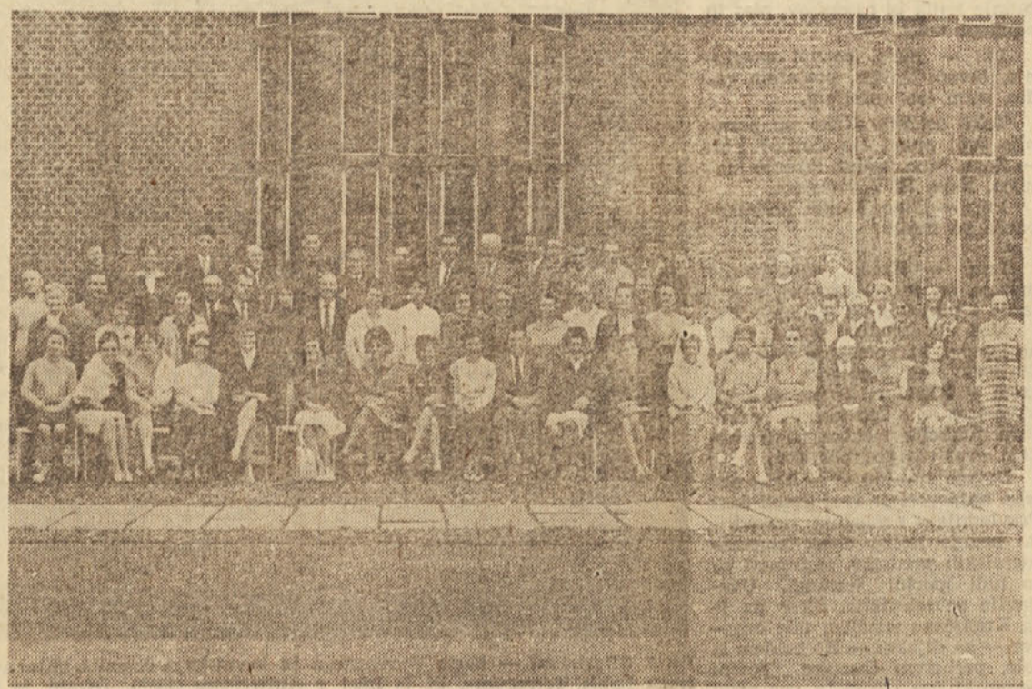
Udeleženci tečaja v Newcastlu

ledanju. Nemože je, da bi v enem članku podala podrobnejšo analizo našega bivanja v Newcastlu smo imeli »social party«, kjer smo se seznanili z angleškimi družinami iz Newcastla in dobili povabila pouk. Peljali so nas tudi v ling-va obiske na domovih. Imela sem srečo, da sem pri vsaki družini spoznala nekaj novega. Pri prvih gostiteljih smo ostali doma ob televizorju in prijetnem og-