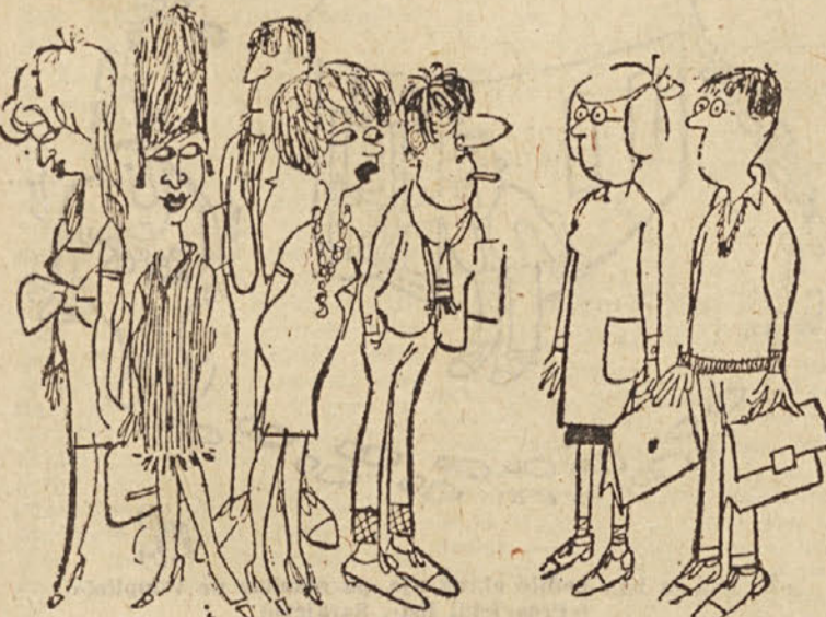
»Kaj pa vidva? Menda ne mislita taka iti v šolo?« («Prosvetni list», Sarajevo)

Prvi (dve) okvirni vprašanja sta bili: — S kakšnim namenom si se pred tremi leti vpisal v to šolo? Kakšen je zdaj tvoj osebni odnos do gimnazije in kaj vidiš v njej? In odgovori na to: — Nobena druga srednja šola mi ni ugovarjala in sem želela nadaljevati študij na univerzi (7 m in 15 ž). — Nisem bil drugod sprejet (1 m in 1 ž). — Po nasvetu staršev (3 m in 5 ž). — V gimnazijo hodim še vedno tako rada kot pred tremi leti (4 ž).